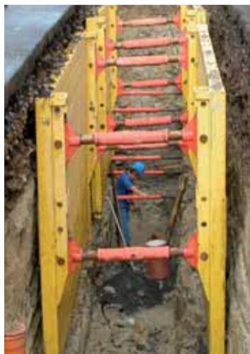
Práce na odkanalizování v aglomeraci Duchcov (finanční objem 105 mil. Kč).

SVS financuje realizaci strategických investic částečně s dotací z fondů EU, částečně alternativním způsobem, bez dotací. S využitím úvěrů letos provádí rekonstrukci čistírny odpadních vod ve Varnsdorfu. Využití úvěrů pro realizaci části investičních akcí naštěstí umožňuje velmi nízká zadluženost z minulosti a dobré hospodářské výsledky. Vlastní finanční zdroje SVS použije k realizaci opatření v rámci projektu Dolní Labe – k rekonstrukci čistíren odpadních vod Želénky, Podbořany, Bilina, Louny a pro odkanalizování