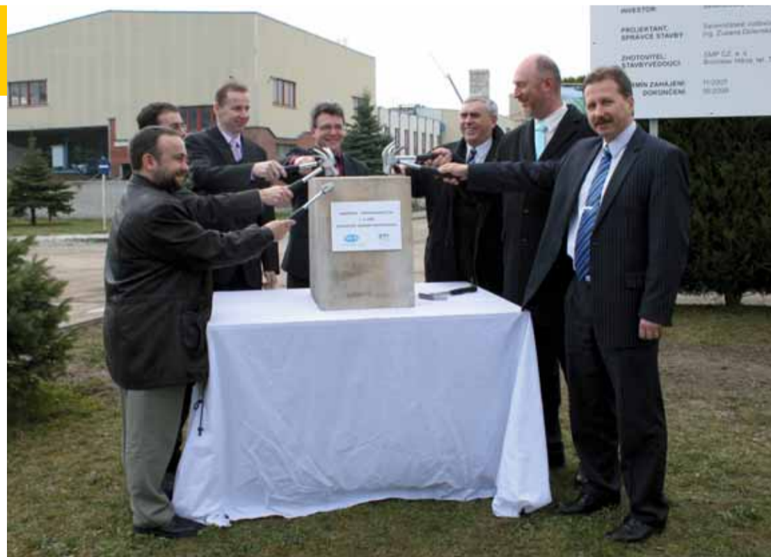
Slavnostní zahájení rekonstrukce ČOV Varnsdorf (finanční objem 210 milionů korun).