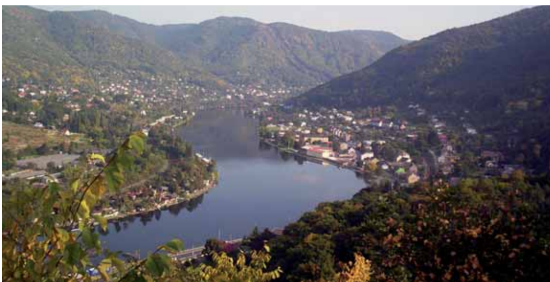
Labské kličky, které ubíhají směrem k Bráně Českého středohoří Portě Bohemice.