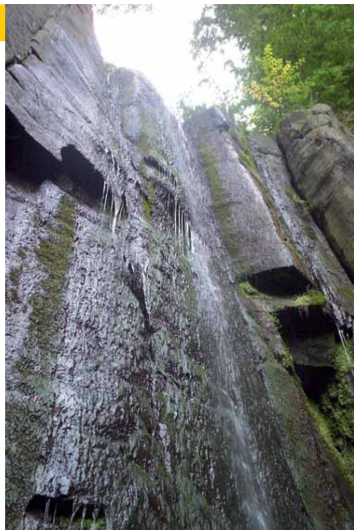
Vaňovský vodopád patří svými dvanácti metry k největším na severu Čech.

ké pohádky jejich námět vychází. Setkáme se tu s věrnými napodobeninami Rumcajse, Manky a Cipiska. Uvidíme i Krtečka, Krakonoše a spoustu zvířat. Mezi stromy tu vykukuje sova, medvěd, ale i mazaná liška. Kousek dál však autor vytvořil také lva nebo pumu. Za pohled rozhodně stojí vodou poháněný mlýn. Zkrátka je na co koukat.