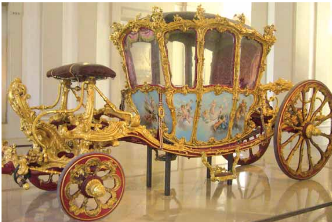
Zlatý kočár ve vstupní hale Lichtenštejnského muzea.

ny. V dámském křídle je nainstalována výstava stříbrného nádobí a servisu, u kterého stolovala a ze kterého jedla císařovna Marie Terezie. Žádný z talířů a příborů si ovšem nemůžete prohlédnout zblízka. Už při prvním náklonu nad stůl se servisem, se v paláci spustí alarm. V bývalých pokojích pro pány se dnes nachází velkolepá klasicistní knihovna, sbírka Lichtenštejnů obsahuje více než sto tisíc svazků. V hale paláce návštěvníky upoutá Zlatý kočár, který nechal v roce 1737 vyrobit kníže Josef Václav I. u příležitosti svého jmenování císařským velvyslancem u francouzského dvora. Knižecí sbírka patřila už v devatenáctém století k hlavním atrakcím Vídně, dnes mají návštěvníci díky sběratelství rodu Lichtenštejnů možnost prožít slávu baroka z první ruky. Návštěvu Lichtenštejnského muzea si určitě naplánujte na neděli. Kromě prohlídky knižecích sbírek se tam můžete v největším světském barokním sále o rozloze šest