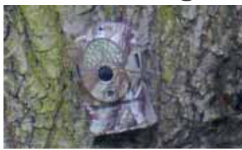
Fotopasti bývají dobře maskovány tak, aby o nich hříšník předem nevěděl.

Hradec Králové | Lidé, kteří místo do popelnic či sběrných dvorů vozi odpadky třeba do lesa či na louku, mohou mít pěknou ostudu. Radnice v Hradci Králové na ně totiž naličila maskované kamery, které je při činu vyfotí.