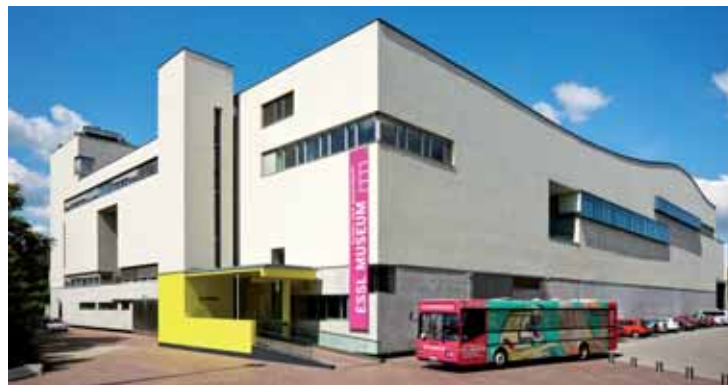
Muzeum moderního umění Essl muzeum.