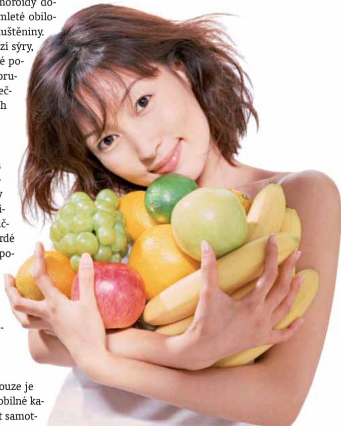
Text: Metropol

ně a nekonzumovat je večer. Ovoce by se nemělo kombinovat se zeleninou. Důležité je dbát na přísun zásaditých potravin, to jsou hlavně ovoce, zelenina, jogurty, sója, mandle, brambory, jáhly, pohanka. Naopak kyselinotvornými potravinami jsou například maso, uzeniny, ryby, mléčné výrobky, ztužené tuky, výrobky z bílé mouky, cukr a cukrářské výrobky, kakao, čokoláda, alkohol, černý čaj a zrnková káva. Jídlo by vždy mělo obsahovat zásaditou složku! Nezapomínejme ale, že kyselinotvorně může působit i stres, hněv, strach nebo nikotin.