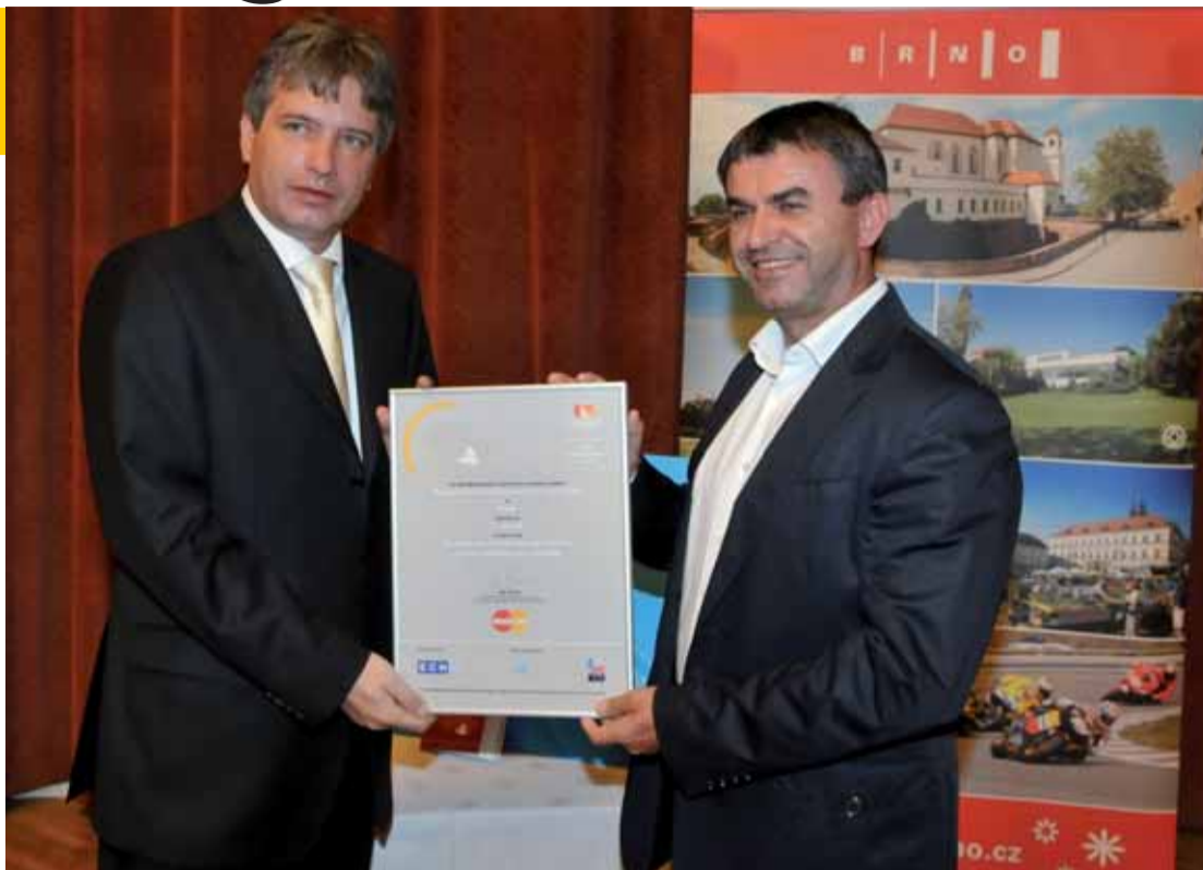
Primátor města Brna Roman Onderka (vlevo) obdržel ocenění za rychlý ekonomický rozvoj města.

Velký potenciál pro další rozvoj Brna spočívá v ekonomice s tím, že Brno zažívá velký příchod zahraničních investorů, kteří zde zakládají své firmy či mají nové pobočky. Jedním z velkých předpokladů je fungující mezinárodní letiště, dobrá infrastruktura města a obrovský lidský potenciál. Ten tvoří zejména vyso-