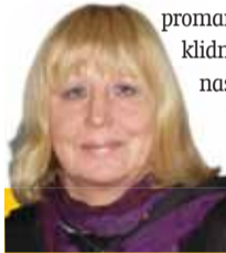
Sestavila: Ludmila Petříková

Panna 24. 8. - 23. 9. Nepodceňujte správné rozložení energie, jinak se vám může stát, že ji nevyužijete konstruktivně, jen ji zbytečně promarníte. Vaše neklidná duše potřebuje nasměrovat, aby proměnila nadání v úspěch.