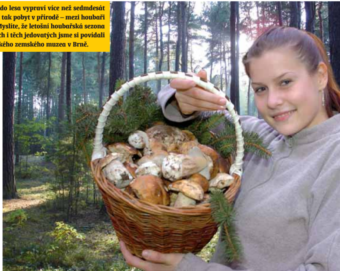
Pohled na takto vrchovatý košík jistě potěší každého houbaře.

Velkou část chráněných druhů nalezneme i na jižní Moravě. Z nápad-