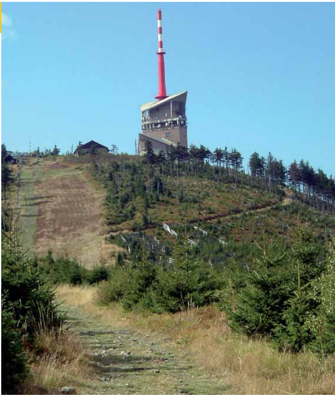
Zcela na vrcholu hory byla vystavěna telekomunikační věž a je zde umístěna i hydrometeorologická stanice.