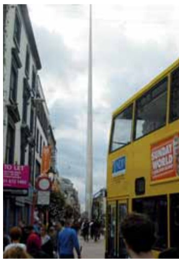
Srdce Dublinu - Spire of Dublin. 120 metrů vysoká kovová jehla.

Dublin je pro většinu turistů pomyslnou vstupní branou do země. Tepající kosmopolitní velkoměsto s milionem obyvatel, které vás na O'Connell Street probodne jehlou. Nepřehlédnutelný monument Spire of Dublin - kovová jehla s průměrem v základu tři metry a ve vrcholových 120 metrech jen 15 centimetrů, váží 126 tun - slouží