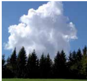
Básník Petr Bezruč zde jistě potkal ne jednu múzu.

bo zvolíme jinou variantu. Po červené můžeme sestoupit do obce Ostravice. Cestou se dozvíme spoustu zajímavostí, neboť půjdeme po naučné turistické trase Lysá Hora. Po žluté barvě se dostaneme do obce Krásná, což je zhruba sedm kilometrů. Při sestupu se