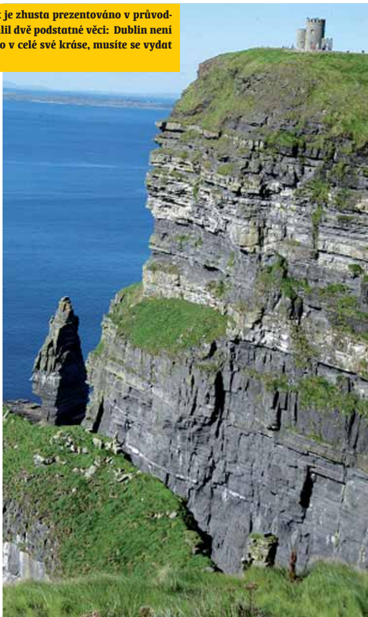
Mohérové útesy na západě Irska se tyčí až do výšky 200 metrů a táhnou se v délce 8 kilometrů.

Z nové části Dublinu do staré (historické) můžete přejít přes nejznámější dublinský most Half Penny Bridge. Pochází z 19. století a náklady na jeho stavbu byly uhrazeny z peněz Dublinanů. Vybrané mostné tvořilo jeden a půl pence. Proto Half Penny Bridge. Bílý litinový most pro pěší, který je na všech pohledech, má oficiální název Liffey Bridge. Důvod, proč se tak jmenuje, je daleko prozaičtější: řeka, která pod ním teče, se nazývá Liffey river. Vyhlášenou čtvrtí „starého“ Dublinu je Temple Bar. Je plná pouličního umění, rockové hudby, alternativních i starousedlických obchodů, moderních i módních podniků, rázovitých pubů. Svoji kariéru zde údajně odstartovala i slavná írská rocková skupina U2.