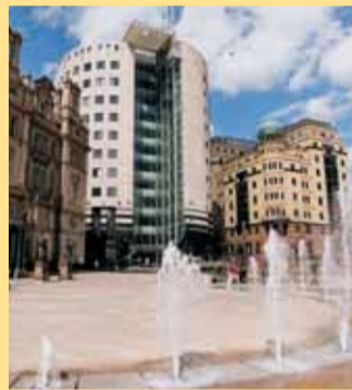
Leeds - partnerské město Brna.

V Brně tak například vystoupila skupina big band Bassa Bassa, na Staré radnici se odehrála vernisáž výstavy umělců ESA (East Street Arts) a své předvedli také studenti z brněnských gymnázií, která mají partnerské školy v Leedsu – Gymnázium M. Lercha, Gymnázium Slovanské náměstí, Klasické a španělské Gymnázium Vejrostova.