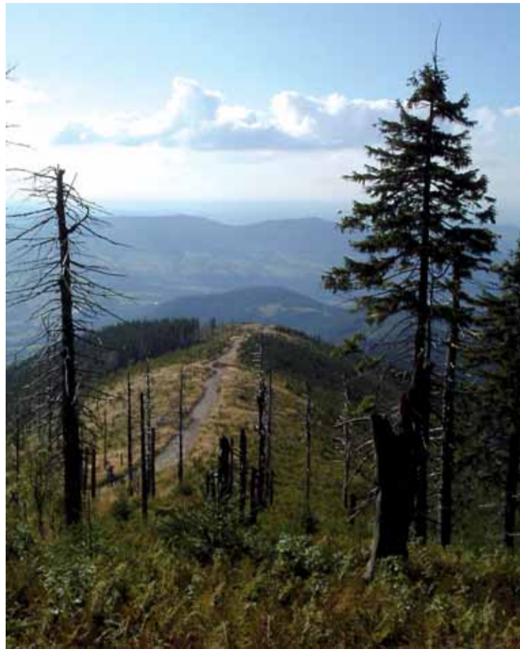
Lysá hora patří k tradičním turistickým cílům pro své krásné rozhledy.

mi loukami se stylovými chaloupkami, které neodmyslitelně doplňují ráz zdejší krajiny. Cestou několikrát zahlédneme siluetu Lysé hory, jež je nám stále blíže. Tvoří ji zvrásněné vrstvy pískovců a jílovců. Vrcholová část se nazývá Gigula, leží nad horní hranicí lesa