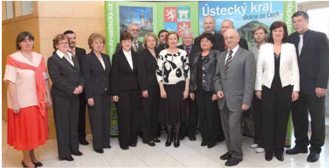
Společné foto představitelů Ústeckého kraje a oceněných pedagogů v rámci Dne učitelů v roce 2011.

V budově krajského úřadu se společně s vedením kraje sešlo 13 oceněných pedagogů „Ústecký kraj si Den učitelů připomíná pravidelně od roku 2004, stala se z toho novodobá tradice a já jsem na to velmi hrdá,“ řekla v úvodním slově hejtmanka Jana Vaňhová a pokračovala: „Vážíme si práce učitelů, protože rozhoduje o tom, jací lidé z našich dětí vyrastou a jaký vztah a postoj si ke vzdělání vytvoří obecně.“ Požádala přítomné pedagogy a jejich prostřednictvím všech téměř sedm a půl tisíce lidí, kteří v rámci kraje ve školství působí, o trpělivost při právě probíhající optimalizaci sítě školských zařízení. „Děláme to velmi citlivě, nechceme nikomu ublížit, naopak chceme mít v regionu kvalitní školství a stále pro něj hledáme finanční zdroje,