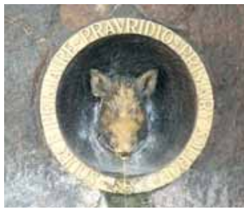
V Lázeňské ulici najdete také kašnu se symbolickou hlavou prasátka, kterému z tlamy vytéká termální voda.

ni, které tvoří tři základní faktory jejich tvorby. Jedná se o homogenní prostředí vyvěřelé horniny „teplického ryolitu“ v celém rozsahu, dále o hlubinné založení mohutného vodonosného ryolitového tělesa až tisíc metrů pod úrovní terénu, kde intenzivně vstřebává teplo Země a získává trvale vyrovnanou mineralizaci včetně významných stopových látek pro léčbu. A v neposlední řadě svoji roli hraje neobyčejně dlouhé, desetitisícileté časové rozpětí od počátku do konce tvorby terem, zaru-