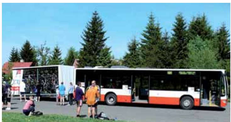
I letos budou moci cyklisté využít ke svým výletům dvě linky cyklobusu z Ústí nad Labem.

První trasa, označená jako číslo 20, vede od Divadla Severočeské opery a baletu přes Zadní Tehličky, Adolfov, Krásný les a Varvažov zpět k divadlu. Ze zastávky v podloubí Krajského ředitelství Policie ČR odjíždí autobus s přívěsem každou sobotu a neděli v 9 a ve 13 hodin. Pokud už cyklisté mají tuto trasu projetou, mohou využít linky číslo 21. Ta odjíždí od divadla ze stejné zastávky, ale její trasa