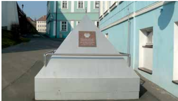
Výsledkem modernizace Pravřídla je jehlan nad šachtou v Lázeňské ulici. V pozadí je dům Zlaté slunce, ve kterém v roce 1812 pobýval L. W. Beethoven.

redakce a obchodní oddělení Severočeského Metropolu připravují zvláštní číslo, věnované zahájení 857. lázeňské sezóny v Teplicích. Jeho součástí bude také historické ohlednutí za uplynulými slavnostmi. Prosíme vás proto, pokud máte ve svých albech k dispozici fotografie z minulého století, o jejich zaslání či zapůjčení. Všechny snímky samozřejmě v pořádku vrátíme. Zaslání fotografie v černobílém nebo barevném provedení by měla obsahovat ročník, jméno autora, krátkou popisku a adresu zasílatele. Snímky s označením „lázeňská sezóna“ můžete zasílat do konce dubna elektronicky na e-mail: redakce@tydeniky.cz , nebo poštou na adresu: Metropol Management, s.r.o., Masarykova 460/11, 415 01 Teplice. Těšíme se na vaše zaslání a předem za ně děkujeme. (met)