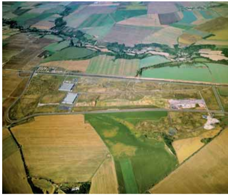
Krajská průmyslová zóna Triangle u Žatce v době výstavby před třemi roky...

Dožrela tedy původně naplánovaný harmonogram, stavební povolení k výstavbě nabylo právní mocí 19. února 2011. Solar Turbines postaví na Triangle zcela nové opravárenské centrum na renovaci plynových turbín Caterpillaru pro značnou část Evropy i dalších kontinentů a v budoucnu tu má zaměstnávat až 450 lidí. Zahájení činnosti závodu se předpokládá v dubnu příštího roku. Těm, kteří dodají stavbu průmyslového závodu pro Solar Turbines EAME s.r.o. vyhrála společnost Swietelsky stavební s.r.o., odštěpný závod Pozemní stavby Západ.