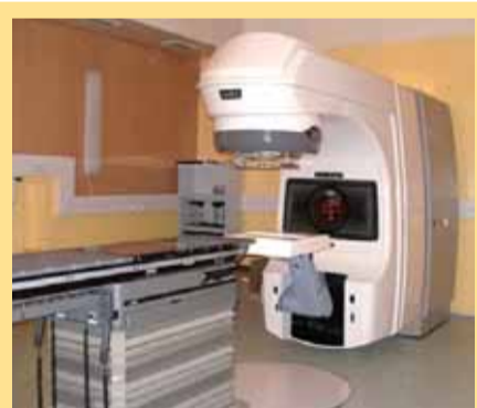
Lineární urychlovač CLINAC DHX High Performance

pacienty s nádory prostaty a v oblasti hlavy a krku. Využití nového přístroje vede k minimalizaci časných a pozdních vedlejších účinků léčby. V neposlední řadě je velkým přínosem zpřesnění reprodukovatelnosti nastavení pacienta při ozáření s využitím portálového snímování a spektra nových fixačních pomůcek – jako např. pánevní ORFIT či vakuové podložky na basi nové technologie.