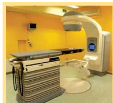
Lékařský simulátor ACUITY iX

přenosu dat a obrazů. Zajišťuje také kompatibilitu v simulaci bloků i elektronových polí s lineárním urychlovačem. Má také možnost volby referenčního obrazu pro portal. Velkým přínosem je propojení plánovacího systému Eclipse s verifikačním systémem Aria. Aria bez problémů připojuje i plánování brachyterapie, existuje tak jediná databáze dat pacientů pro externí terapii i brachyterapii, verifikační systém lze připojit na PACS. Aria má také dořešenou elegantní verifikaci IMRT - portálovou dozimetrii včetně vymezení ROI a skvěle podporuje porovnávání s referenčním obrazem v modulu on-line a off-line review.