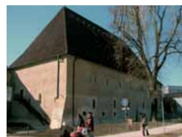
Gotický hrad je další dominantou Litoměřic.