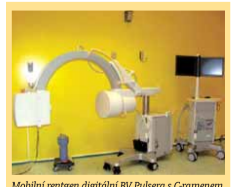
Mobilní rentgen digitální BV Pulsera s C-ramenem

Omezení provozu kobaltového ozařovače díky větší kapacitě lineárního urychlovače snižuje riziko radiční zátěže personálu.