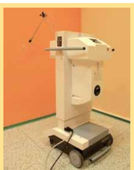
Automatický afterloading GammamedPlus iX