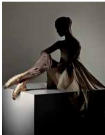
Sošná fotka Popelky.

Pohádku Popelka na hudbu Sergeje Prokofjeva připravuje soubor baletu Národního divadla na 14. a 15. dubna jako svou druhou velkou premiéru sezony.