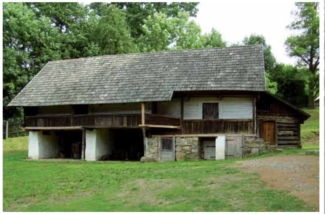
Hospodářské stavení z Městečka u Olbramovic.

Od roku 2009 je zde také realizována výstavba čtyř nových objektů - vodního mlýna z Radešic, stodoly z Mašova, obytného domu z Jíví a seníku z bývalého katastru Záběhlá resp. Buková u Rožmitálu ve Vojenském újezdu Brdy. Jejich úplné zpřístupnění veřejnosti se předpokládá pravděpodobně v závěru tohoto roku či na začátku příštího. Návštěvníci skanzenu