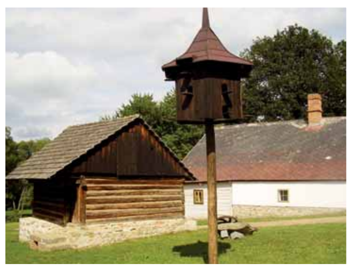
Špíchary a holubník z osady Pojezdec u Kosovy Hory.

tak mají jedinečnou možnost sledovat znovuvzkříšení těchto objektů na vlastní oči. Cena výstavby replik objektů si vyžádá náklady okolo 26 milionů korun. Každý, kdo se na chvíli rád zastaví, sem může vypravit, a když ne hned, třeba na jaře, či v létě. Zastavit se, zasnít se na chvíli a představit si, jaké by to bylo, žít před sto dvěma sty lety