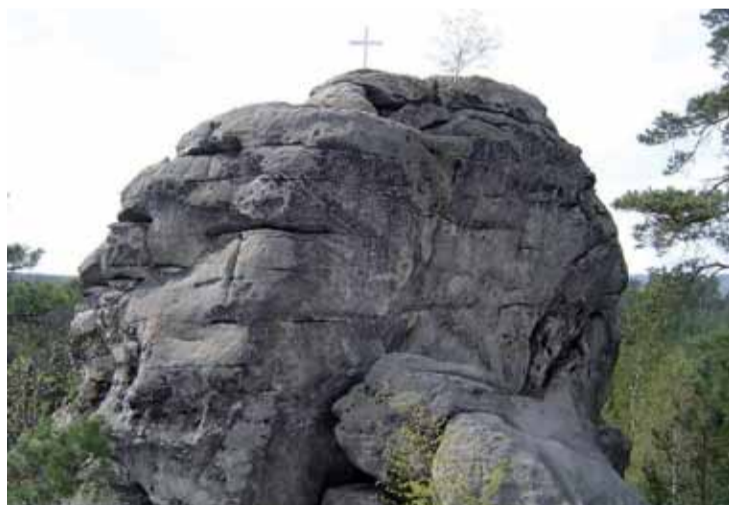
Vrcholky Havraních skal jsou přístupné po tesaném schodišti.

Ke Klíči se odedávna vztahovaly četné lidové pověsti. Podle některých stával na vrcholu hory hrad, jehož zbytky prý měly být patrné ještě koncem 18.