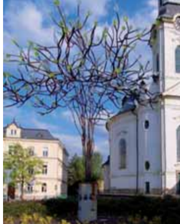
Skleněný strom Bořka Šípka.

Otevřeno je kromě pondělí každý den od dubna do listopadu. Objevíte zde reprezentativní výběr z muzejní sbírky dokumentující stylový a technologický vývoj českého skla od 17. století do druhé třetiny 20. století. Více než 550 exponátů zachycuje vývoj sklářství především z borsko-šenovské oblasti. Seznámí vás také se základy technologie výroby a zušlechťování skla (malování, rytí, broušení, hutní techniky). Prostřednictvím archivních dokumentů se dozvíte zajímavé podrobnosti ze zdejší sklářské historie. Neunikne vám ani několik netradičních kousků od známého designera Bořka Šípka, který je s městem víc než spjatý. Dokonce jeden jeho výtvar - skleněný strom - zdobí kruhový objezd v blízkosti náměstí a samotného muzea.