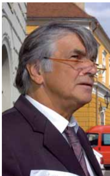
Jiří Bartoška v pokračování Nemocnice.