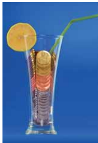
Kariéru lze udělat díky vlastním schopnostem nebo hlouposti jiných Jean de La Bruyère