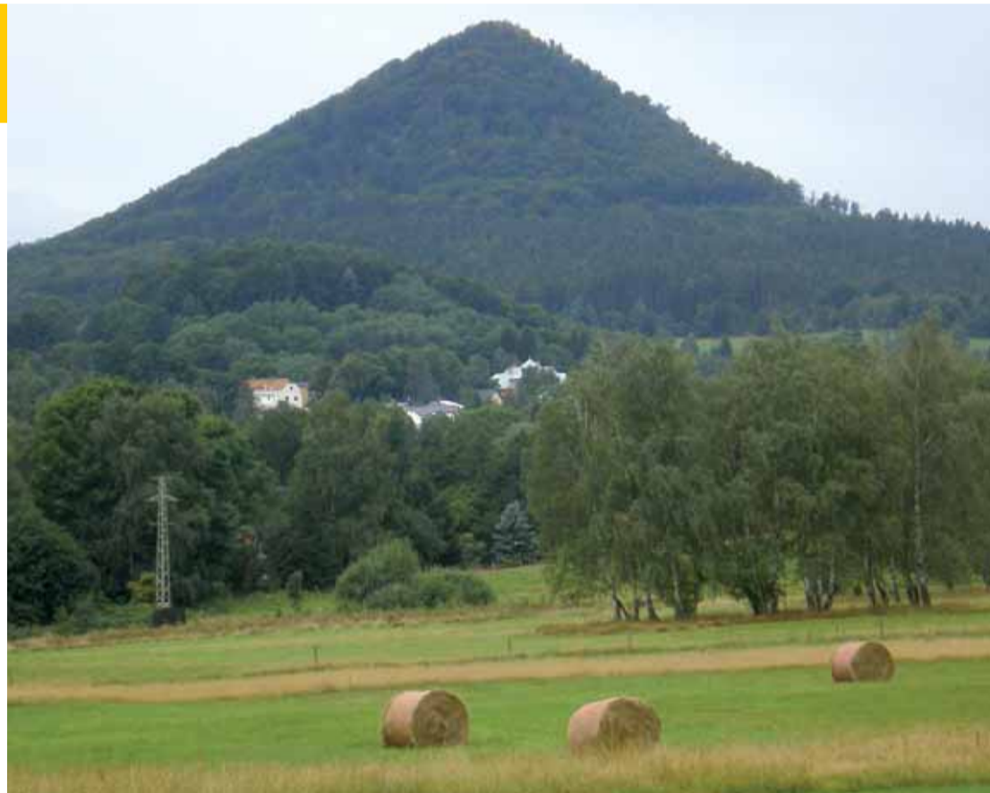
Kopec Klíč, s typickým kuželovitým tvarem (ze severovýchodního pohledu), je jednou z dominant Lužických hor.

Na mapách se hora poprvé uvádí roku 1720 pod jménem Kleis. Jako Klíč je uvedena až v průvodci z roku 1928. Jméno hory se odvozuje od praslovanského výrazu „ključ“, kterým bývala označována vyvěrající voda. Pod