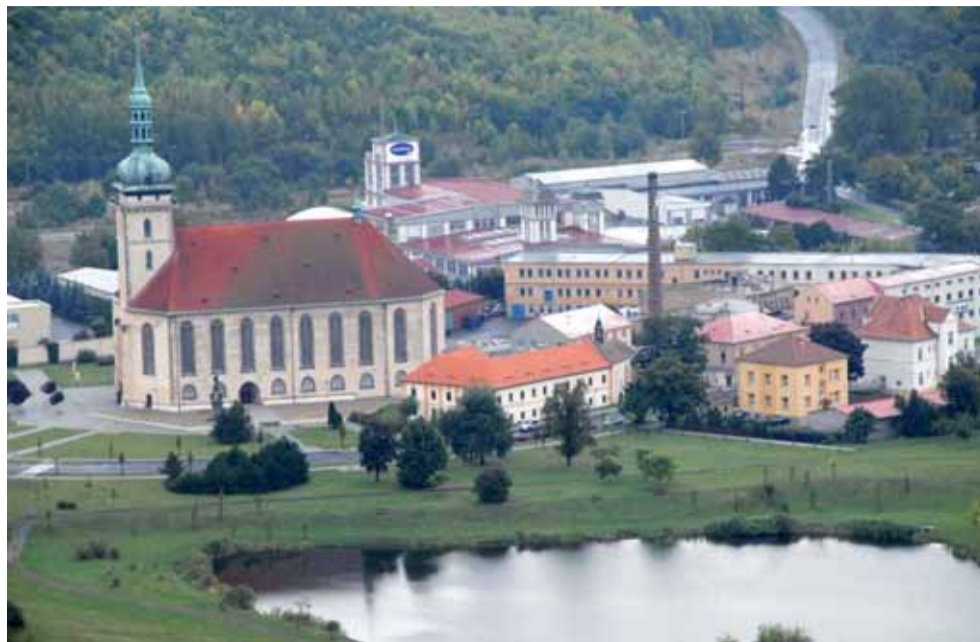
Rarita - přesunutý kostel Nanebevzetí Panny Marie v Mostě

jízdné zdarma pro děti do 6 let je přeci běžný standard ve všech městech v Ústeckém kraji, kde funguje městská doprava. Děti od 6 do 15 let mají v Mostě skutečně nově od 1. září 2007 jízdné zdarma, ale jen pokud jsou držitelé čipové karty (která není zadarmo), jen v tarifním pásmu 1 a jen po dobu školního roku. Důchodci dosud jezdí za po-