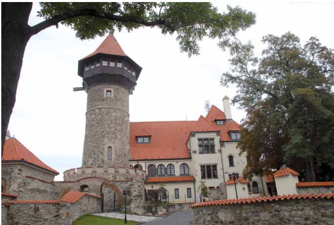
Dominanta Mostecka - hrad Hněvín

Růst kriminality se v podstatě zastavil, ale klesá objasňenost případů. To nebude předvolební téma?