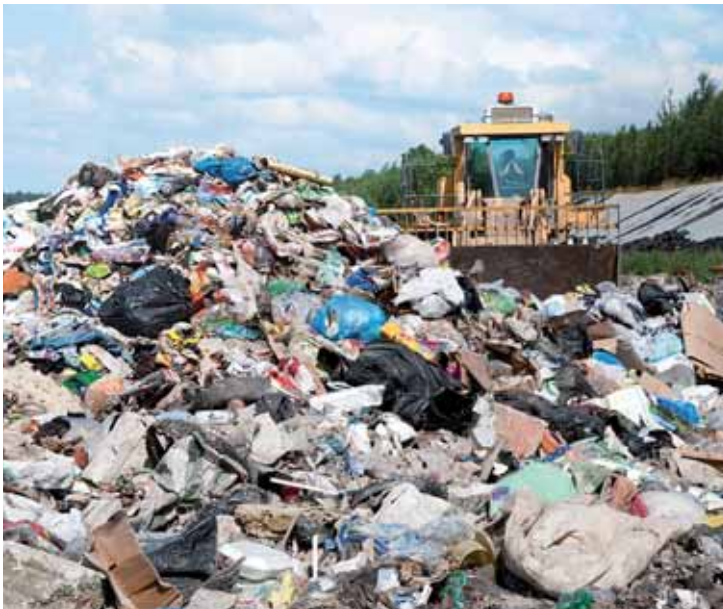
Skládka v Chotíkově na Plzeňsku už kapacitně nestačí. Proto je třeba, aby ji nahradila zbrusu nová spalovna.

dy zhruba 66 000 tun komunálního odpadu. Do Chotíkova se dále bude svážet odpad ze vzdálenosti do 40 kilometrů, tedy z Rokycanska, Plzně-severu a jihu i z Tachovska. „Záměr kraje také je, aby se odpad takto likvidoval. Nemůžeme ho pořád zahrabávat do země,“ dodal Smutný. Jediným limitujícím faktorem je dopravní vzdálenost. Roční kapacita spalovny bude do 100.000 tun, což je maximum, které kraj slíbil obci Chotíkov. V regionu přitom končí ročně na skládkách do 150 000 tun komunálního odpadu. Ročně se ho vyprodukuje 246 000 tun a jeho ob-