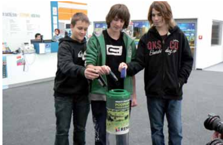
K dobré věci přispěli v Techmanii i žáci ze Zruče (na snímku).