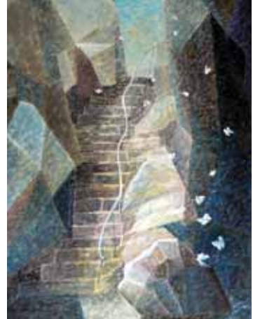
Tatiana Tichá: Schody ve skále, tempera