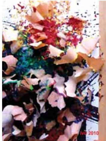
Ivo Oberstein: Veselý den, kombinovaná technika