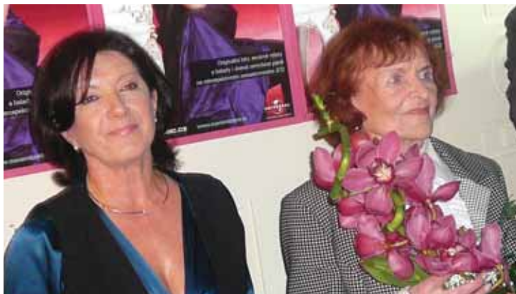
Marie Rottrová a Jiřina Fikejzová při křtu společného alba.

Česká Lady soul Marie Rottrová a legendární textařka Jiřina Fikejzová pokřtily 23. listopadu v baru La Musica v centru Prahy své společné retrospektivní album Osud mi tě přál .