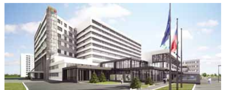
Vizualizace probíhající rekonstrukce polikliniky Budějovická v Praze.

Ve stavební sezóně 2009 - 2010 SYNER, s.r.o., z obrátu cca 3 mld. korun realizovala pro soukromé investory zakázky za 2,3 mld. Kč, pro veřejný sektor za 700 mil. Kč, z toho za 0 Kč pro Statutární město Liberec.