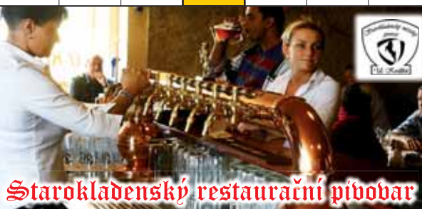
Starokladenský restaurační pivobar