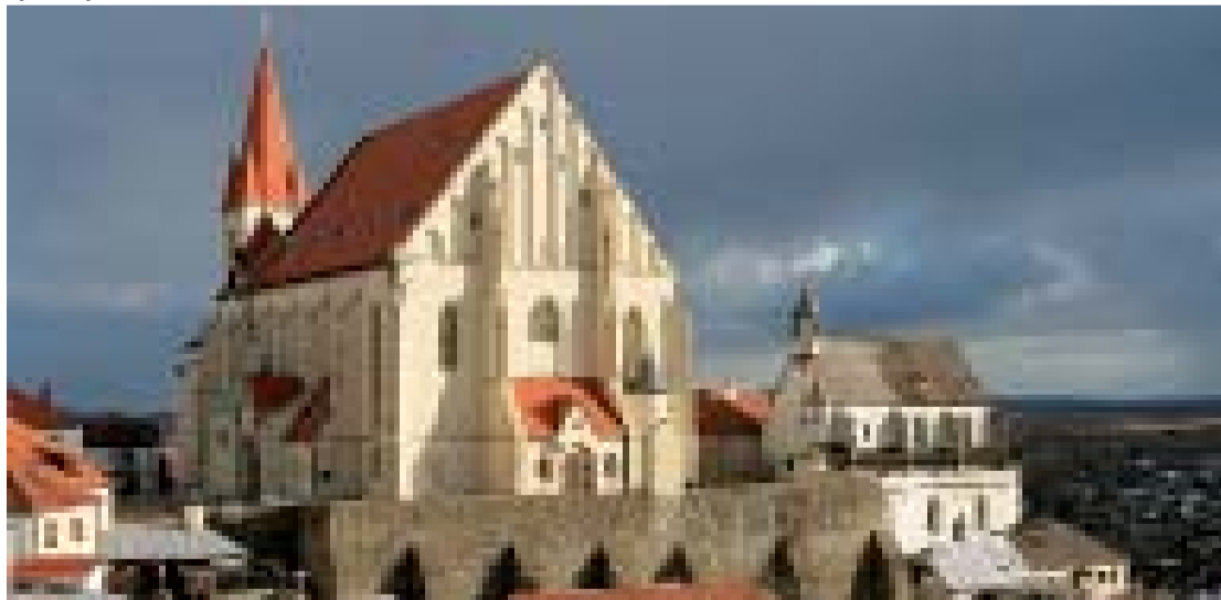
Mikulášské nám., vlevo kostel sv. Mikuláše, vpravo Svatováclavská kaple