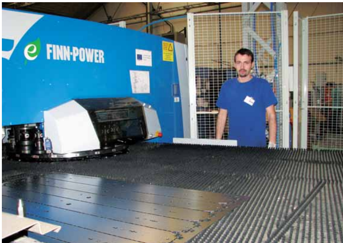
Nové vystřikovací a děrovací automaty, na jejichž pořízení získala firma MODUS v roce 2009 dotaci z Evropského fondu pro regionální rozvoj, přispívají k vysoké kvalitě a efektivnosti výroby svítidel.

V současné době byl firmě schválen nový dotační titul pro inovaci produktů a technologií. To umožní zakoupit ve světě nejrychlejší řešení na řezání plechů laserem a robotické pracoviště na laserové svařování korpusů svítidel. „Tato investice nás posune výrazně dopředu, hlavně co se kvality týče. Bude me tak schopni konkurovat těm nejlep-