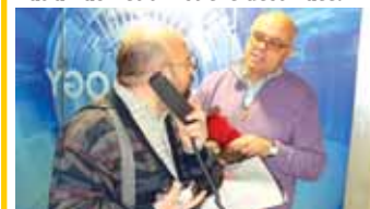
Účastníci mezinárodního setkání během prohlídky Informačního centra Ledvice.