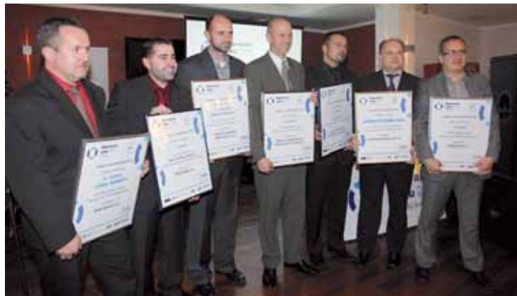
Představitelé oceněných dopravních společností pěkně spolu...

„Těší mě, že se do ankety o nejlepšího dopravce našeho kraje zapojuje stále více cestujících. Výsledky ankety jsou pro nás cennou informací o tom, jak se zlepšuje kvalita cestování v Ústeckém kraji, neboť z pětistupňové škály nedostal žádný z dopravců horší známku než 2,6, naproti tomu v roce 2009 dostal nejhorší dopravce známku 3,22,“