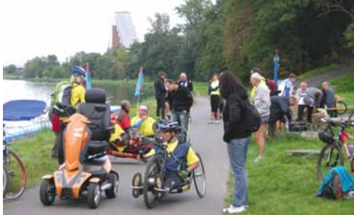
Labskou cyklostezku využívají vedle cyklistů nebo bruslařů také handicapovaní sportovci. Náš záběr byl pořízen při nedávné akci Tour de Labe handicap v Roudnici n. L.

„Jsem velmi ráda, že se na předních příčkách umístily jak velké investiční projekty, tak zároveň tzv. měkké akce, jako například projekt Po stopách praotce Čecha nebo Atletika pro děti. Šanci na úspěch měly zejména akce s regionálním nikoliv lokálním významem,“ uvedla hejtmanka Ústeckého kraje Jana Vaňhová. Do ankety bylo nominováno 20 projektů, které kraj financoval nebo se na nich finančně podílel. Veřejnost vybírala nejlepší akce od 30. září do 29. října 2010 na