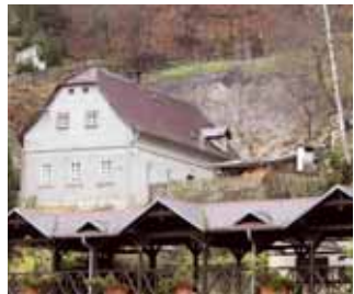
Část nákladů na sanaci sesunutého svahu u čp. 96 v Hřensku pokryje finanční dar 150 000 Kč

Na mimořádném 19. zasedání schválilo Zastupitelstvo Ústeckého kraje rozdělení přijatých finančních darů určených na odstranění následků povodní z letošního srpna.