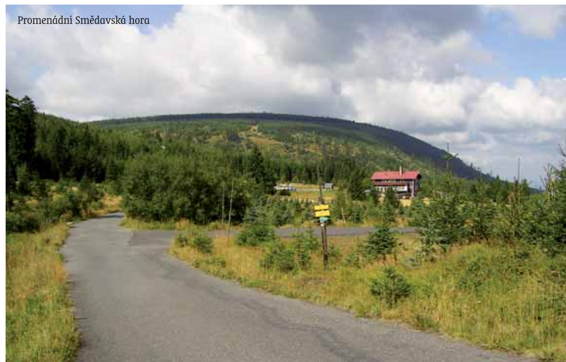
Promenádní Smědávská hora

stále šumící lesy, blankyt oblohy. Vysoké stromy, velikáni rostlinné říše, zjara svítící svíčky klečí, v létě plno žlutí květu kycolu, mezi smrků četné hub, stráně ozdobeny černí borůvek. Zvláštní náladu má kraj, když v raném podzimu spadnou první vločky a všude je bílo.