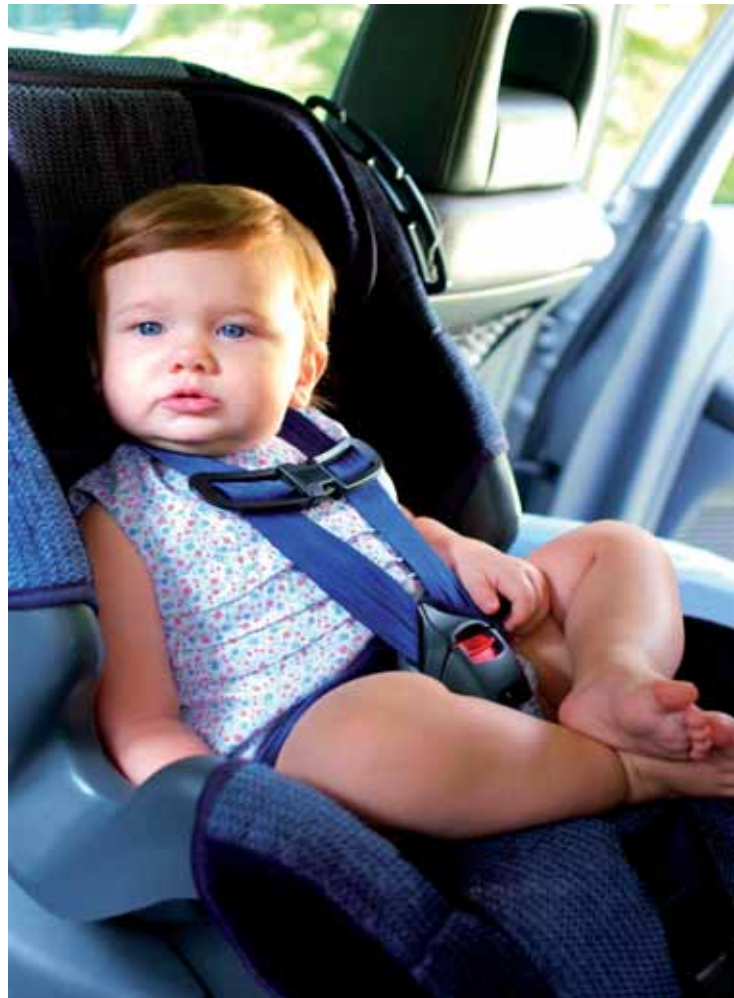
Výběr správné sedačky je důležitý nejenom pro bezpečnost dítěte.