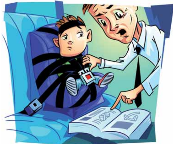
Nastudování manuálu od výrobce autosedačky je nezbytně nutné!

přesně podle návodu. Příliš volně uchycené sedadlo nebo volně připoutané dítě – tento problém se nejčastěji vyskytuje u dětských lehátek a u systému „kalthotových šli“. Nebo na jedné straně není dětské sedadlo uchyceno co možná nejpevněji popruhem. A samozřejmě také dětská sedačka se nehodí k autu nebo k dítěti.