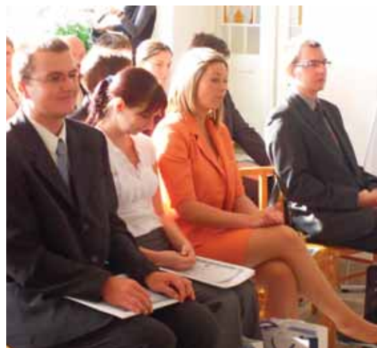
Některí z nových držitelů Dobrých listů komory.