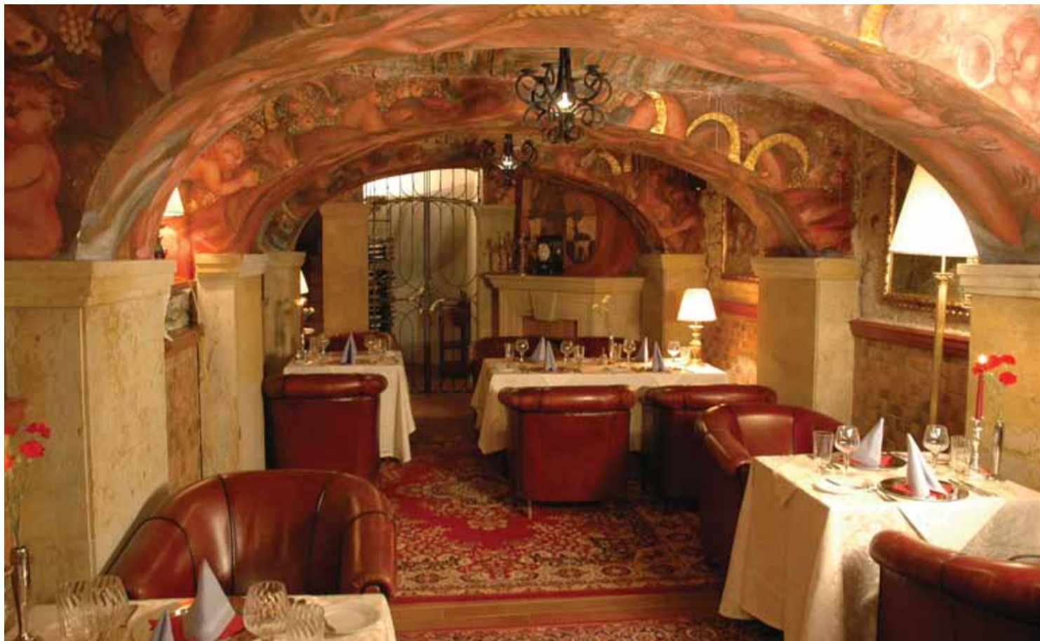
Romantické, diskrétní posezení nabízí také bar v hotelu U Páva na pražské Malé straně.

Veškerý kapitál, plynoucí z prvního hotelu, jsem investoval do zakoupení dalšího objektu, jehož historie sahá do roku 1386, tentokrát na Malé straně U Lužického semináře. Ten jsme opět zrekonstruovali v duchu romantických hotelů. Tak vznikl hotel U Páva. Protože podpora úředníků pražského magistrátu byla mizivá, rozhodl jsem se investovat v Brně. Tam se mi podařilo získat objekt