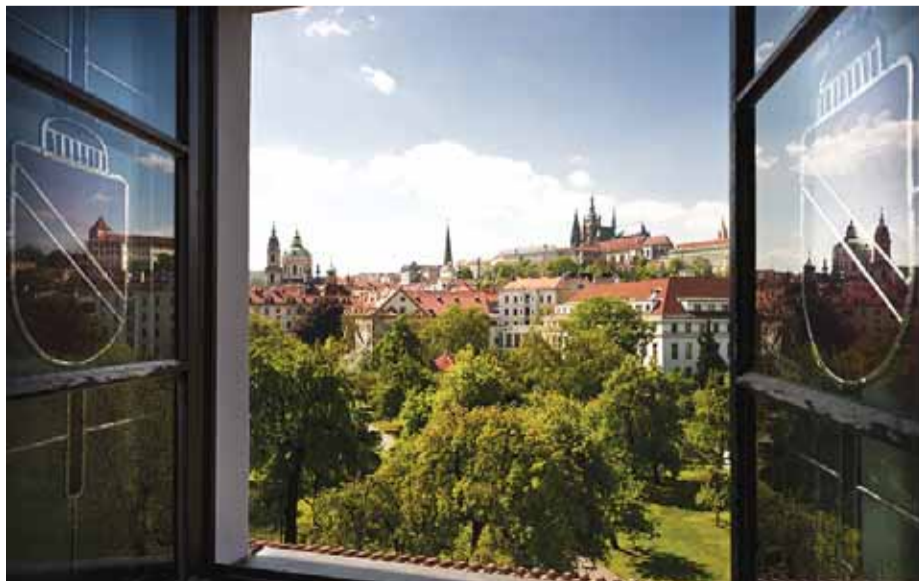
Jeden z pokojů hotelu U Páva v ulici U Lužického semináře v Praze s překrásným výhledem na Hradčany.