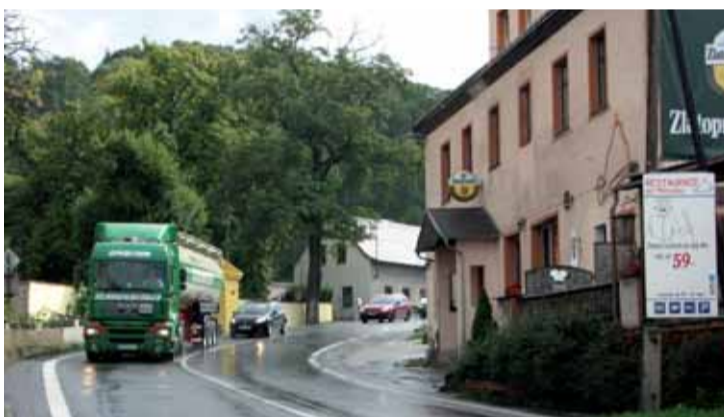
Bořislaví prochází frekventovaná E 55 ve strmém klesání s nebezpečnými zatáčkami.

K tomu se musí vyjádřit všichni účastníci tohoto procesu. Je to zdlouhavá záležitost, protože jde o stovky lokalit a stovky lidí. Stavba je rozdělena na několik úseků, když momentálně jsou povoleny práce na třech samostatných stavbách, což je most Opárno, Dobkovičky a tunel Prackovice. V polovině srpna bylo zahájeno stavební řízení na trasu A, což je vyrovnaní terénní vlny v katastru Litochovice, Prackovice a Chotiměř. Bylo k tomu vydáno stavební povolení, očekáváme, že i v tomto případě dojde k dalšímu odvoláním, která průběh prací oddálí. Tím samozřejmě nedo-