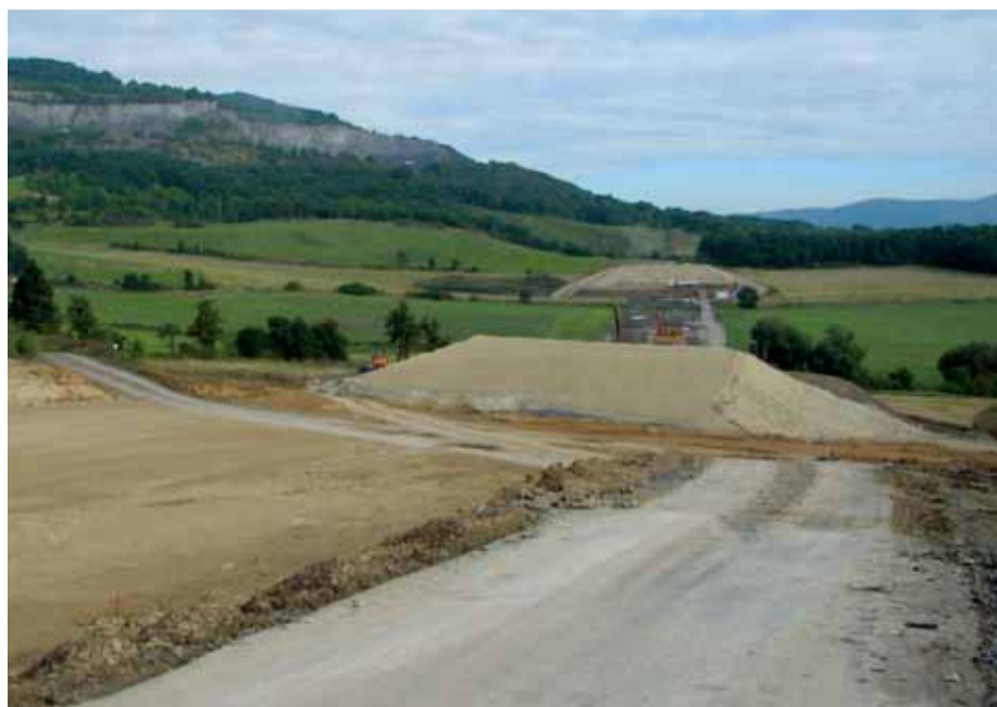
Směr budoucího úseku k tunelu Prackovice.