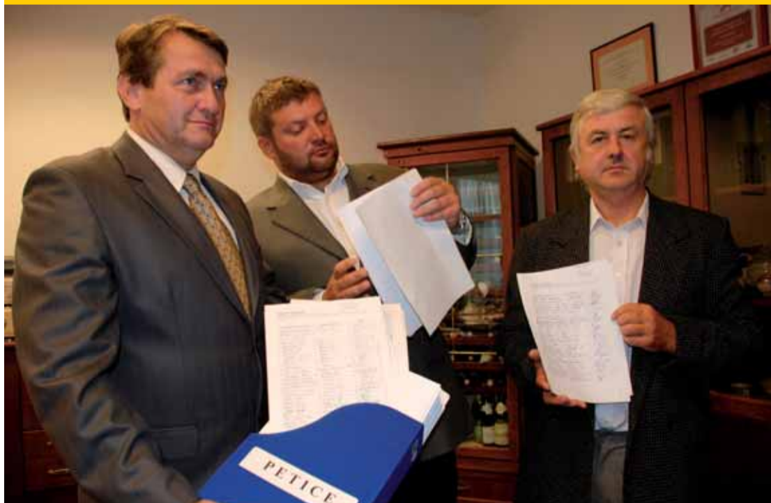
Hejtmán Jiří Šulc, ministr dopravy Aleš Řebíček a starosta Velemína Jiří Skalický s petičními archy.

Ústecký kraj | Sto padesát obcí z celého Ústeckého kraje se připojilo k petiční akci na podporu dostavby dálnice D8, kterou iniciovali starostové z obcí a měst, přes které vedou náhradní dopravní trasy nahrazující nedostavěný poslední úsek dálnice D 8 z Řehlovic do Lovosic.