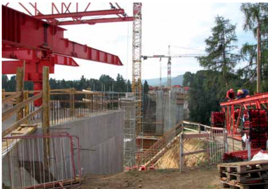
Výstavba mostu přes Opárenské údolí.