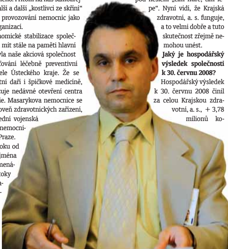
Text: Metropol

Nenechte se znechutit ani vystrašit „zaručenými“ zprávami o nepravostech v Krajské zdravotní. Bude jich, zejména v této předvolební době, pravděpodobně mnoho – viz například zcela vykonstruovaná kauza laboratoře. Krajská zdravotní je dobře řízená a fungující firma, která ve všech svých nemocnicích zajišťuje a bude zajišťovat stále se zlepšující zdravotní péči pro všechny obyvatele Ústeckého kraje.