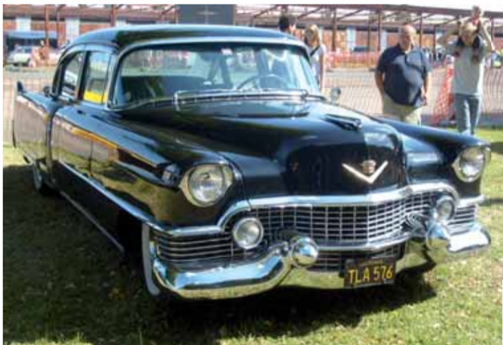
Návštěvníci mohli na CHROM&PLAMENY VII. American Day v Luštěnicích obdivovat i černého krasavce z roku 1954 - Cadillac Sixty.