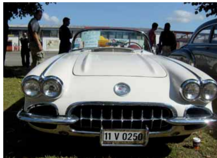
„Bílá dáma“ - Chevrolet Corvette z roku 1960 - s obsahem 4800, výkon (HP) 161.