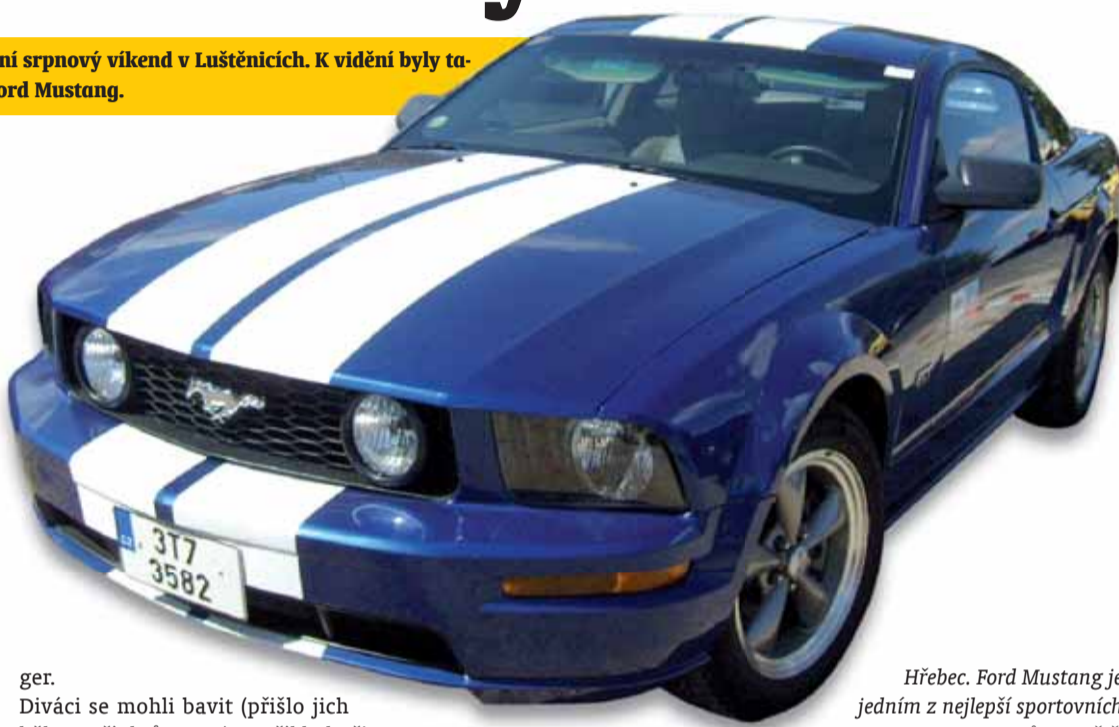
Hřebec. Ford Mustang je jedním z nejlepších sportovních vozů na světě.

ger. Diváci se mohli bavit (přišlo jich během tří dnů 6 500) například při Tank show. Ptáte se, co dělal tank na srazu „amerik“? Odpověď je prostá: válcoval. Tedy lépe řečeno přejel favorita tam a zpět. Nezbylo z něho nic než placka. „Byl to mžik a z fáčka zůstal jen mastný flek,“ dobře se bavil Jiří Peřina z Ústí nad Labem.