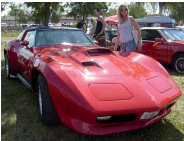
Chevrolet Corvette C3.