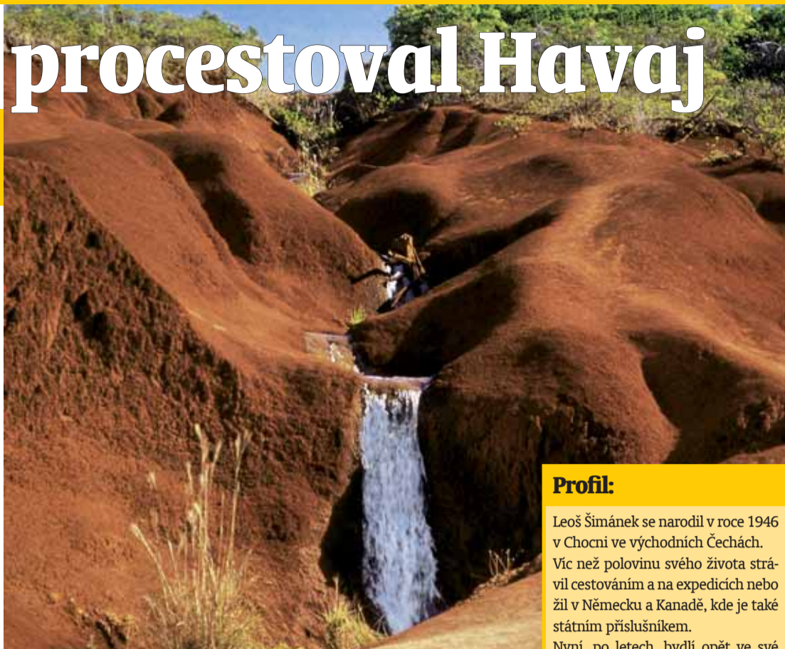
Potok stékající z pobřežních hor na západní straně ostrova nedaleko cesty.

metrů dlouhé pouti od pobřeží Aljašky do havajských teplých vod, kde se samičím rodí mláďata.