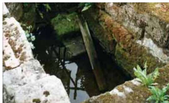
Studna, ze které chtěl vystrašit děda ve vodnickém převleku vnuka. Na druhém snímku je místo, kde filmové rodince chutnal chléb posypaný pažitkou. Zde také děda vyzvídal, proč Luboš pořád běhá za Vaškovo mámou...