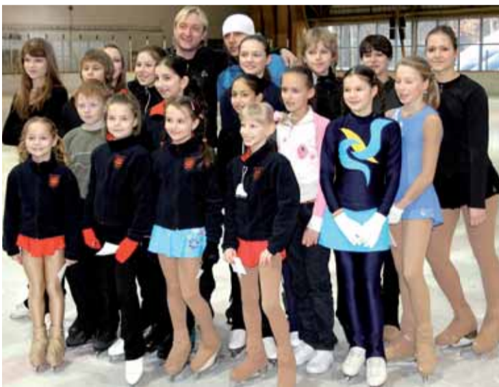
Malí krasobruslaři z USK Praha, které Pljuščenko během své návštěvy hlavního města trénoval.