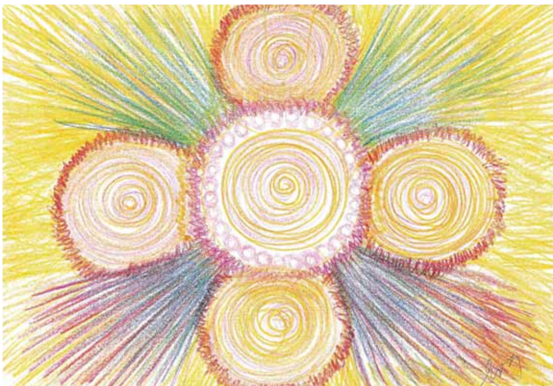
Tento obrázek dodává energii a harmonizuje na všech úrovních: fyzické, mentální, emocionální a duchovní.

Při zasvěcení do prvního stupně Mistr Reiki předává adeptovi iniciaci energetických center (čaker) schopnost přijímat a předávat energii Reiki. Mnozí