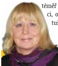
Sestavila: Ludmila Petříková

Ryby 20. 2. - 20. 3. Neustálé dumání, hloubání a úvahy, kterým se v poslední době hojně podrobujete, dosahují téměř filozofických rozměrů. Zkuste si začít své myšlenkové pohyby zapisovat. Třeba jednou vydáte knihu.