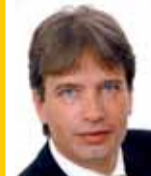
Roman ONDERKA primátor města Brna

Co byste popřáli právě vycházejícímu Moravskému METROPOLU?