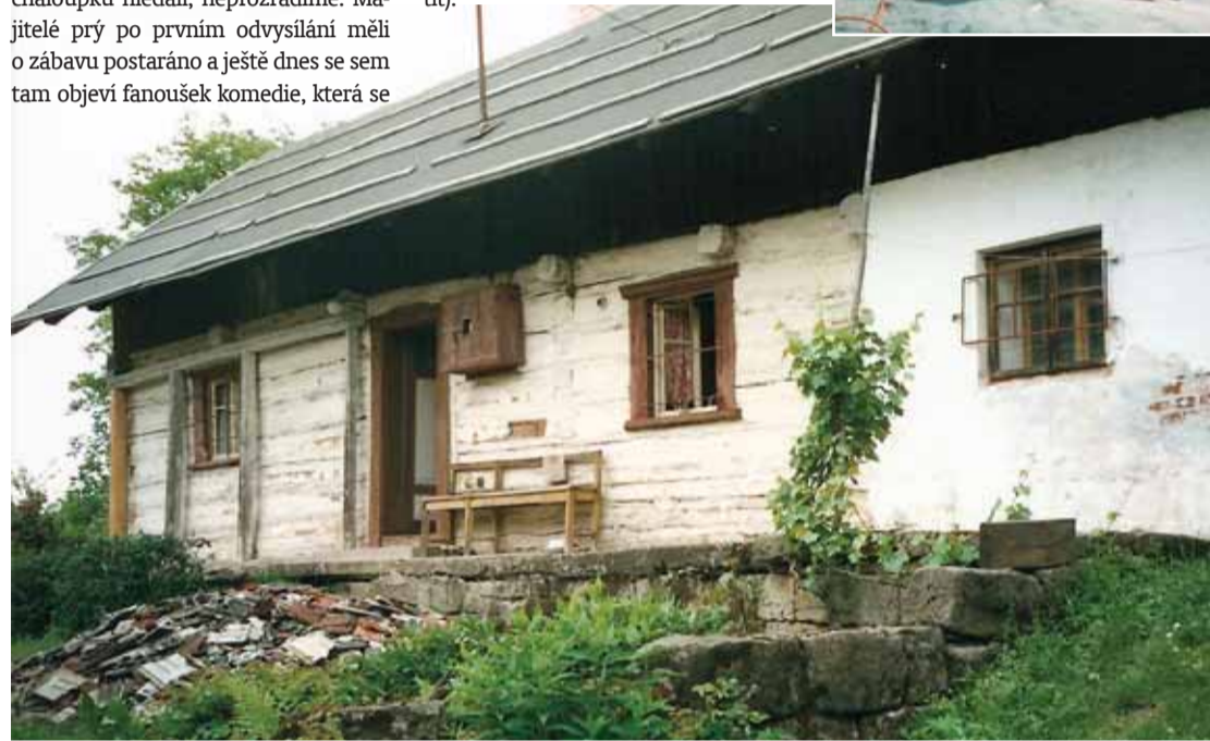
V době, kdy jsme slavnou filmovou chaloupku v Českém ráji vypátrali, se její majitelé chystali opravit střechu.