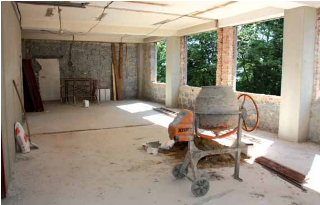
Práce na rekonstrukci prostor budoucí mateřské školy v Masarykově nemocnici již byly zahájeny.

Projekt je zaměřen na vybudování firemní školky pro 50 dětí předškolního věku a má zajistit možnost rychlého a plnohodnotného návratu do pracovního procesu pro jinak znevýhodněné skupiny osob – zaměstnanci/kyně KZ MNUL s dětmi předškolního věku. To přispěje k doplnění chybějícího stavu zdravotnického personálu.