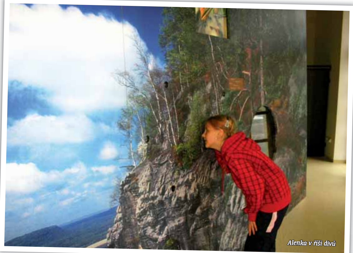
Alenka v říši divů

Součástí expozice je i panoramatická projekce na téma Krajina zrozená z písku a moře a kinosál s kapacitou až 50 míst. A právě zde na vás čeká vyvrcholení celé expozice ve formě dvacetiminutového emotivního filmu s názvem Krajina tajemství. Máte tak možnost shlédnout nejen působivé záběry na krajinu a přírodu Českosaského Švýcarska, ale zaposlouchat se i v anglickém jazyce do autentic-