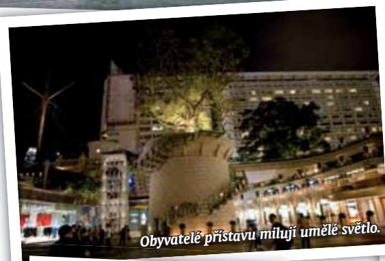
Obyvatelé přístavu milují umělé světlo.