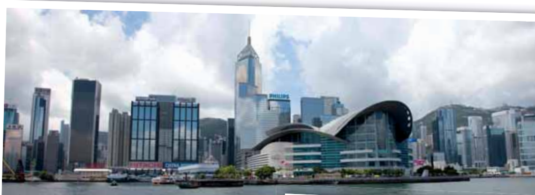
Pohled na Hongkong z Jihočínského moře.