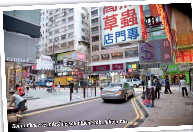
Komunikace ve městě nejsou hlučné tak, jako u nás.