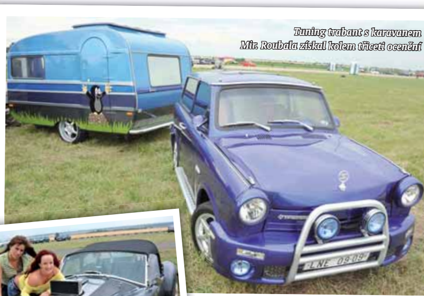
Tuning trabant s karavanem Mlr. Roubala získal kolem třiceti ocenění