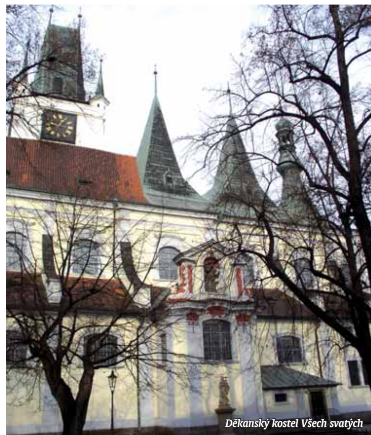
Děkanský kostel Věch svatých

je vysoká 54 metrů a pochází z poloviny 14. století. Na kostelním náměstí býval dříve hřbitov. Kostel najdeme na Mírovém náměstí. Při cestě z nádraží ho jistě nemineme. O pár desítek dál nás čeká pohled na nejstarší zachovalý měšťanský dům. Pochází z druhé poloviny 15. století, je postaven v gotickém slohu a je známý jako Gotické dvojče. Název si dům vysloužil díky dvojitému štítu. Dominantu malého Václavského náměstí tvoří Kostel sv. Václava. První zmínky o něm hovoří v roce 1363. Původně gotický kostel byl přestavěn v barokním slohu. Při rekonstrukci v 90. letech byly v kopuli nalezeny staré mince a záznamy o tehdejší době. K dalším neopomenutelným stavebním památkám patří městské hradby a parkány. Vnitřní hradba pochází ze 14. století, v nejvyšším místě dosahuje 10 me-