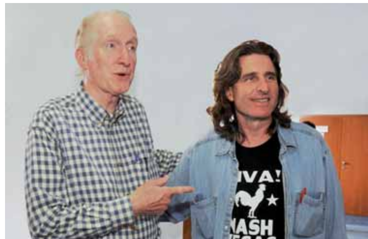
Otec George Hamilton V. a syn George Hamilton VI. v Ústí nad Labem.

Tomuto historickému počínu předcházelo setkání obou osobností country hudby ve stejném roce na festivalu v Londýně, kde Jiří Brabec nabídl Georgovi návštěvu tehdejší ČSSR. Tato nabídka byla skutečně až v roce 1982, ale o to byla srdečnější – oba přátelé nahráli desku