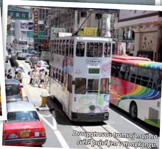
Dvoupatrovou tramvaj mají na světě právě jen v Hongkongu.