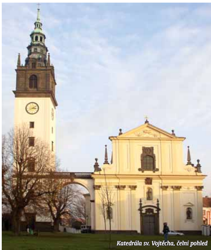
Katedrála sv. Vojtěcha, čelní pohled

Litoměřice jsou v čase spojeny s jednou z ikon českého romantismu. Kvůli místu advokátního koncipienta přichází v září roku 1836 do města Karel Hynek Mácha (1810-1836). Český básník, prozaik a zakladatel moderní české poezie, jehož dvousté výročí narození si právě letos připo-