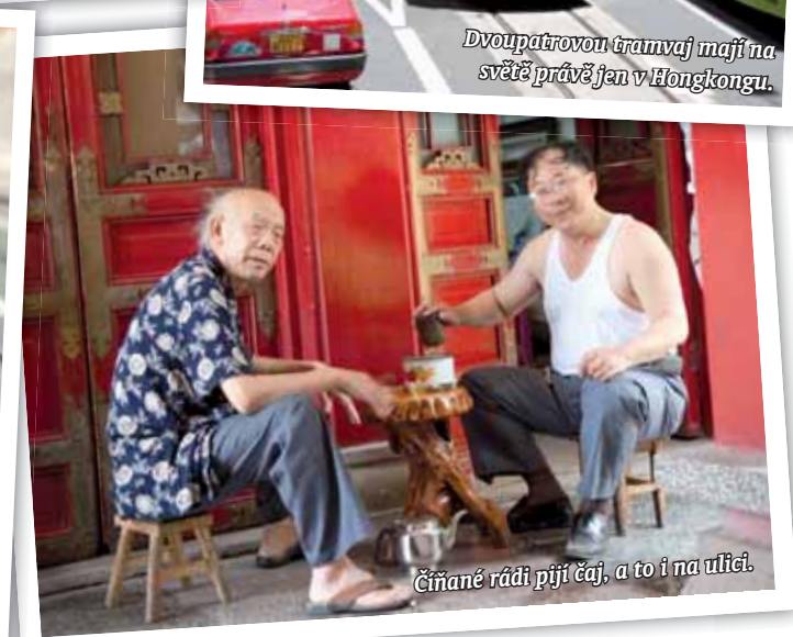
Číňané rádi pijí čaj, a to i na ulici.