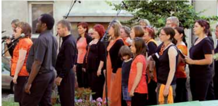
Svátek sv. Jana přišel pacientům KNL, a. s., připomenout koncertem písní soubor Generace Gospel Choir. Na pozvání dobrovolnického centra Dobromysl účinkoval v nemocnici už potřetí.