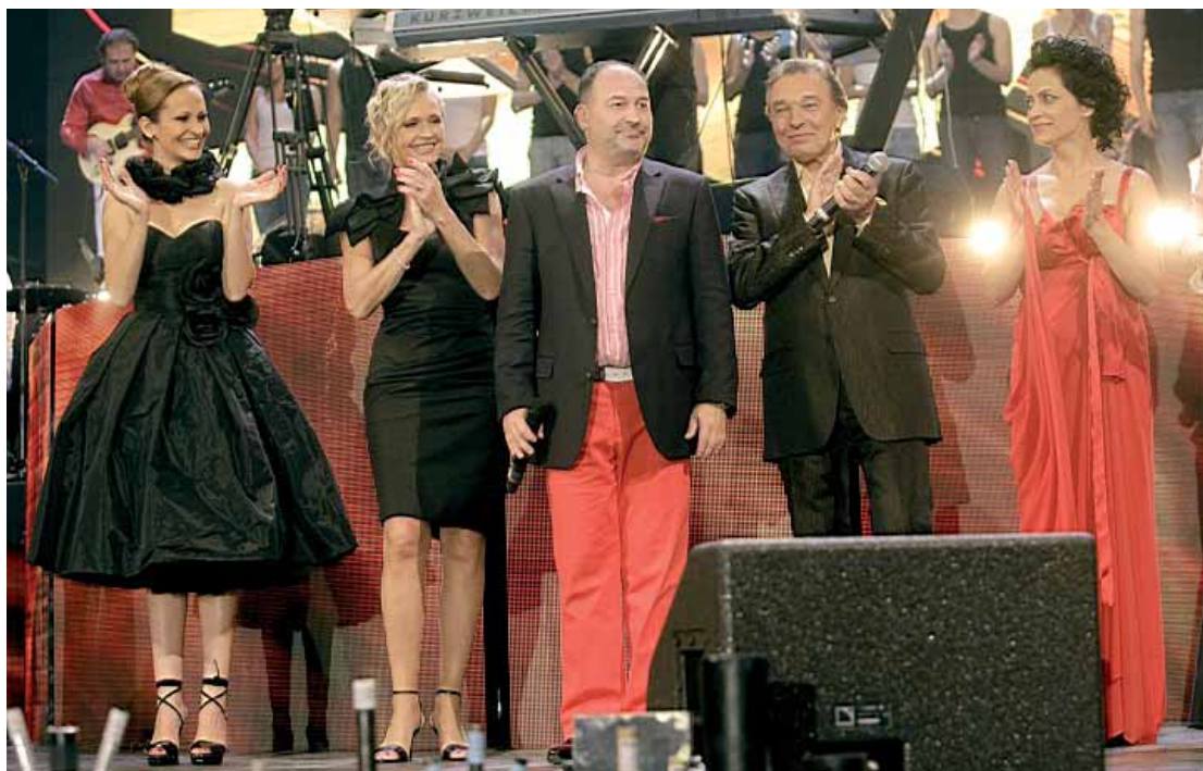
Monika Absolonová, Helena Vondráčková, Michal David, Karel Gott a Lucie Bílá na Mejdanu roku.