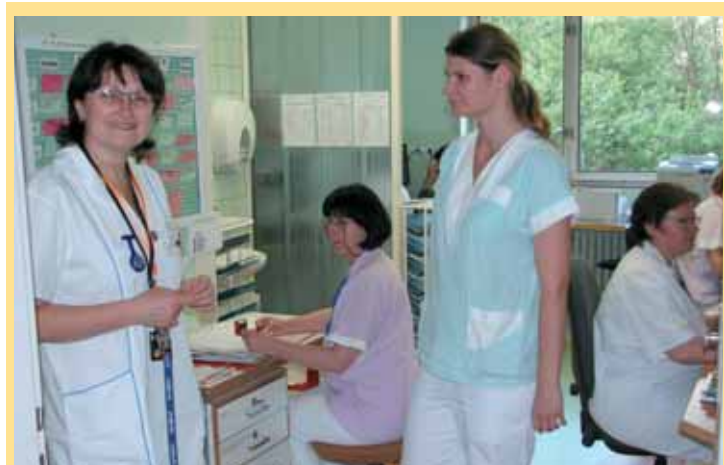
Další modernizaci loni prošlo rovněž oddělení geriatrické a následné péče (LDN) v pavilonu D, což přispělo ke zvýšení komfortu pro pacienty i personál. Oddělení nyní disponuje 99 lůžky v Liberci a 43 lůžky v Jablonném v Podještědí. Na snímku pohled do sesterny v pavilonu D.