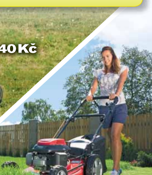
Ceny sekaček od 990 Kč