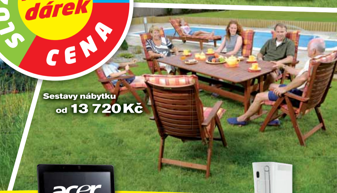
Sestavy nábytku od 13 720 Kč