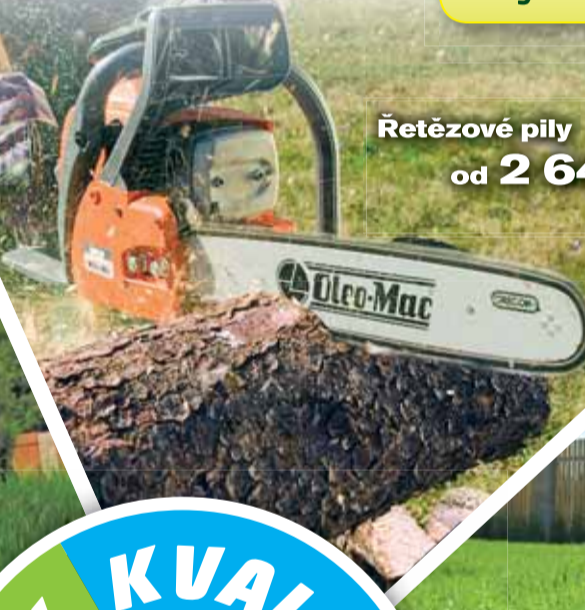
Řetězové pily od 2 640 Kč