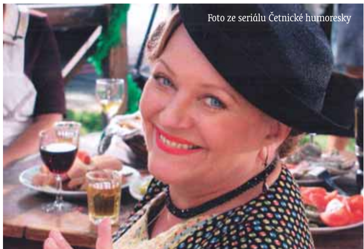
Foto ze seriálu Četnické humoresky