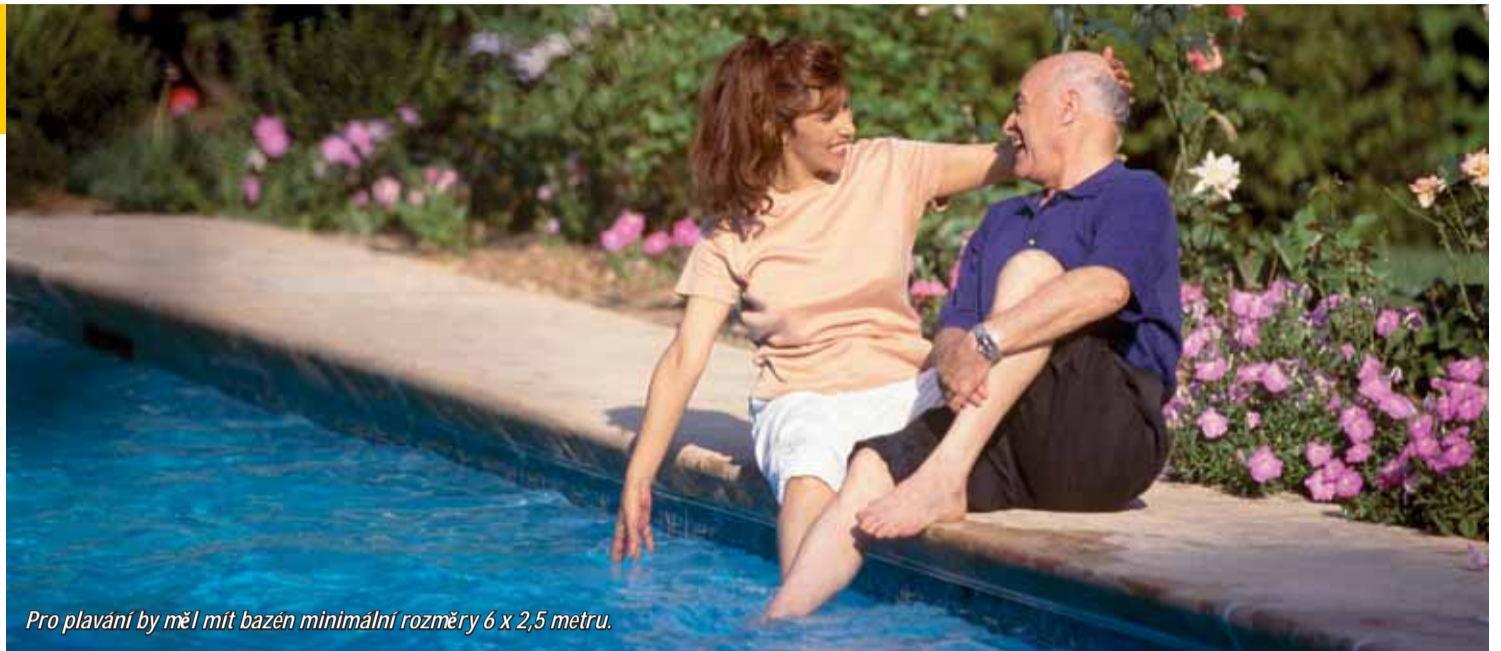
Pro plavání by měl mít bazén minimální rozměry 6 x 2,5 metru.

Pro plavání by měl mít bazén minimální rozměry 6 x 2,5 metru, s hloubkou nejlépe větší než 1,2