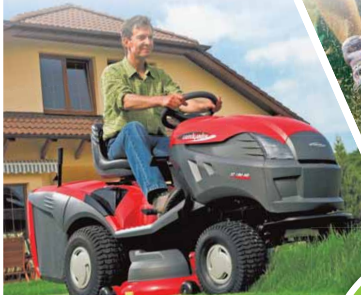
Ceny traktorů od 27 190 Kč

Ve všech našich 54 prodejnách pro vás máme otevřeno 7 dní v týdnu , tedy i v SOBOTU a v NEDELI .