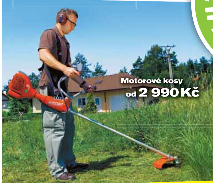
Motorové kose od 2 990 Kč