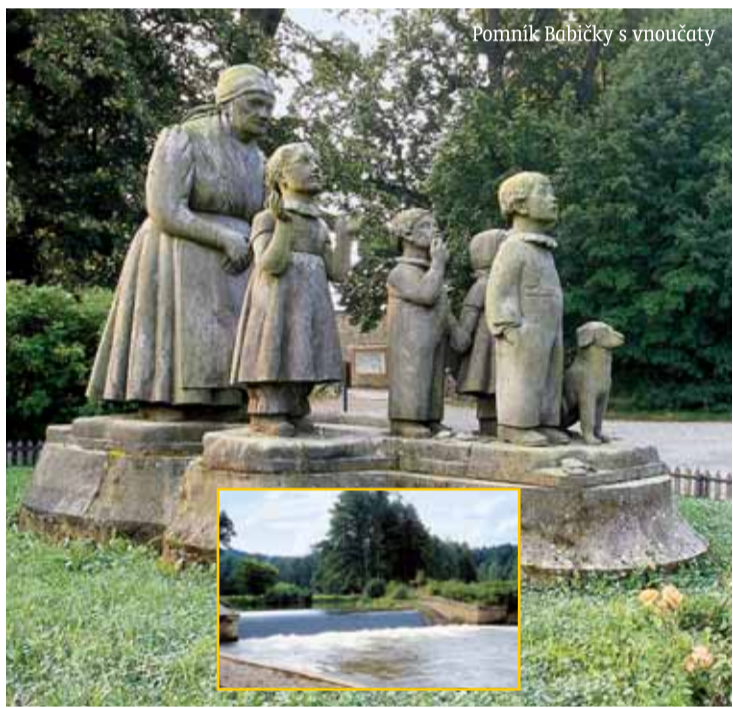
Pomník Babičky s vnučáčky

Hoře získali Náchodské panství Trčkové z Lípy. Poslední český majitel, Adam Erdman Trčka z Lípy, byl zavražděn spolu se svým švagrem Albrechtem z Valdštejna v Chebu roku 1634.