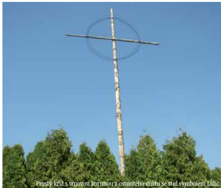
Prostý kříž s trnovou korunou z ostatního drátu se stal symbolem Lidic