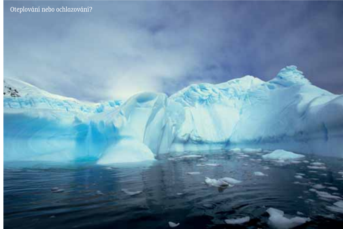
Oteplování nebo ochlazování?

velmi tuhé zimy a studená léta. Tento graf se stal hlavním podkladem 3. zprávy IPCC pro důkaz oteplování v roce 2001. Důvod, proč tento graf je v podstatě lživý, vychází z odlišných metod měření pro období před průmyslovou revolucí a po ní. Starší data odvozoval Mann z letokruhů stromů, nové období získal z měřících přístrojů. Přitom přešel fakt, že stromy na výkyvy teplot příliš nereagují. Mannovo matení veřejnosti nesprávným grafem bylo nejspíše úmyslné a tento graf se stal hlavním argumentem klimaskeptiků již několik let zpět. Aféru Climagate, však spustily zcizené mailly britských klimatologů (pracujících v ústavu, ze kterého čerpá IPCC). Jsou-li mediální kopie těchto mailů pravdivé, jedná se o brutální porušování vědeckých a do značné míry i morálních zásad. Nejen, že v mailech bylo několikrát nabádáno k falšování dat, ale též k utajování nepříznivých zjištění a umlčování kritiků (Zdroj Wikipedie – Climagate). „Nezávislá“ vyšetřovací komise však před týdnem došla k závěru, že se o falšování vědy nejednalo. Sami autoři své mailly nepopírají a tvrdí, že šlo jen o zjednodušení grafů pro širokou veřejnost. Některé hříchy, kterých se tyto vědci dopustili, jsou však prokázány: odmítali zpřístupnit a zveřejnit své zdroje (ačkoli jim to zákon přikazuje) a záměrně mazali soubory dat, aby vyšetřovatelům znemožnili práci. Pokušili se rovněž zabránit otiskování článků vědců s opačným ná-