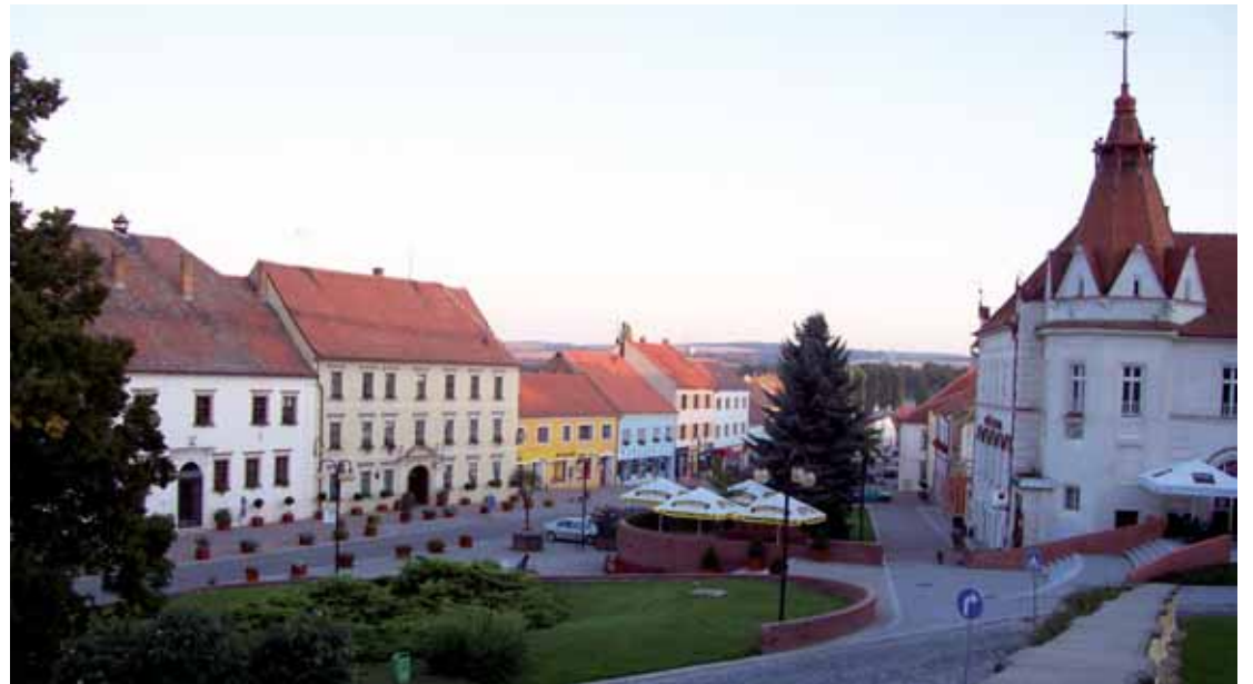
Pohled na Slavkovské náměstí od zámku

Městečko Slavkov leží na Jižní Moravě, jen kousek východním směrem od Brna. V zahraničí je město Slavkov u Brna známé spíše pod názvem Austerlitz a to především jako dějiště Bitvy tří císařů.