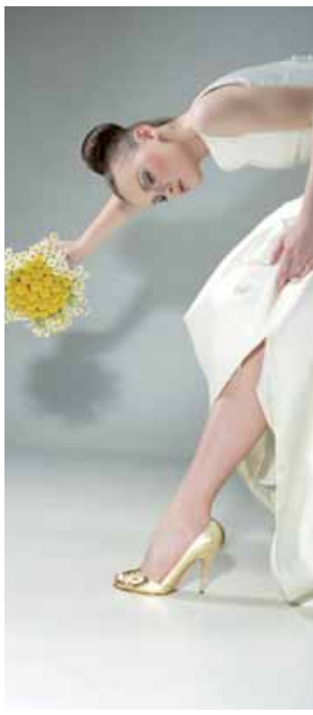
Heřmáněk a chryzantéma