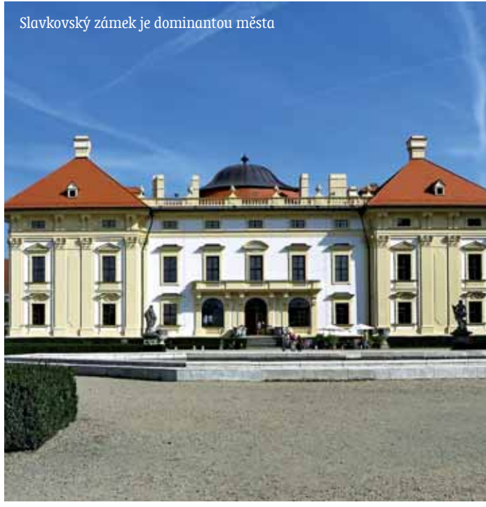
Slavkovský zámek je dominantou města