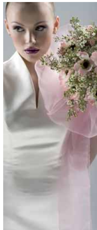
Sasanky a květy waxy