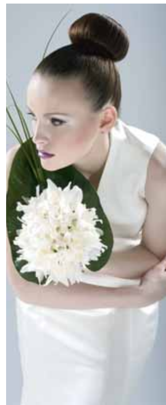
Bílé orchideje na anthuriovém listu