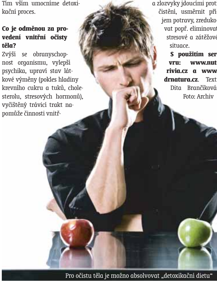
Pro očistu těla je možno absolvovat „detoxikační dietu“

S použitím serveru: www.nutrivia.cz a www.drnatura.cz . Text: Dita Brančíková, Foto: Archiv