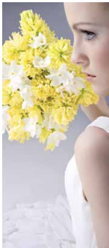
Žluté hyacinty a bílé mini narcisy