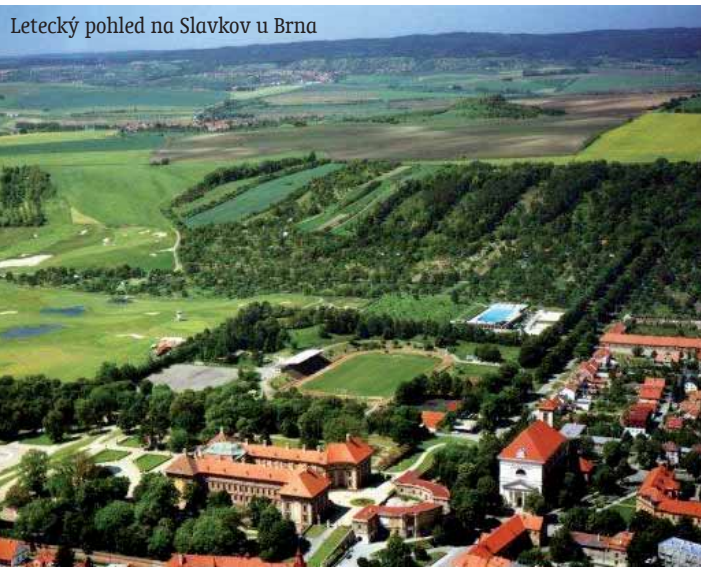
Letecký pohled na Slavkov u Brna