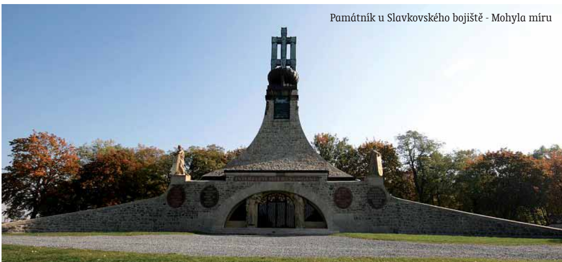
Památník u Slavkovského bojiště - Mohyla míru