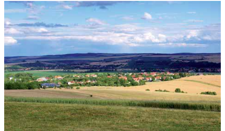
Pohled na Křenovice

V roce 2001 se obec umístila na prvním místě v okresním kole soutěže „Vesnice roku“ a téže soutěži získala v krajském kole „Modrou stuhu za