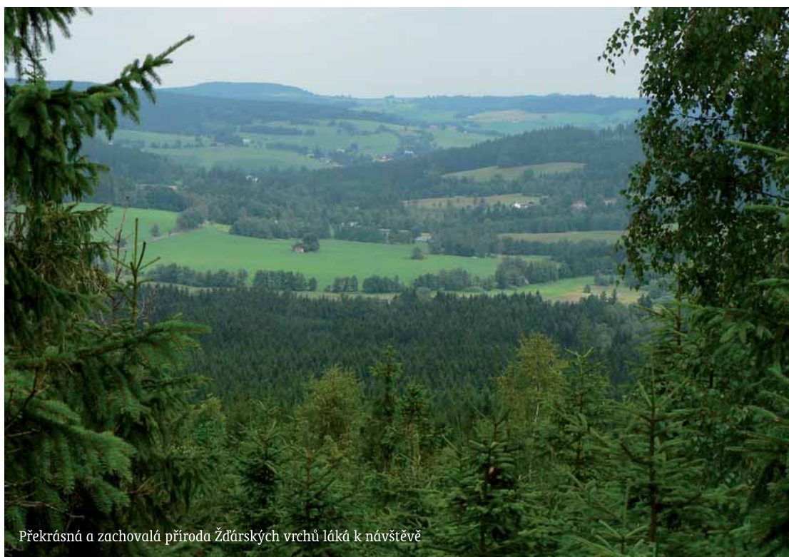
Překrásná a zachovalá příroda Žďárských vrchů láká k návštěvě

Cesta naší výpravy vychází z vesničky Herálec po modré turistické značce