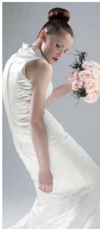
Starorůžové velkokvěté cocumbijské růže, kořen afrického keře