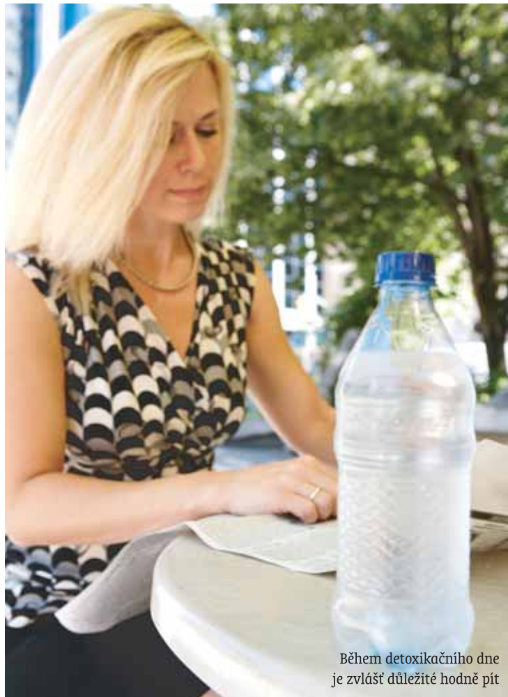
Během detoxikačního dne je zvláště důležité hodně pít

Proto je pro naše tělo pravidelná vnitřní očista nutným předpokladem pro uchování (či navrácení?) zdraví. Dopřejme