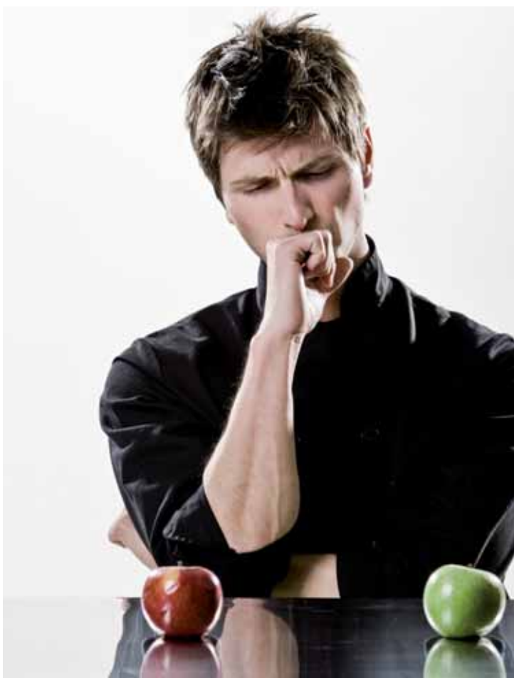
Pro očistu těla je možno absolvovat detoxikační dietu.

Pro očistu těla je možno absolvovat detoxikační dietu, pít vodu, ovocných a zeleninových šťáv, bylinných čajů, potravinové doplňky, očistu střeva (klystýry, hydrocolon terapie) a v neposlední řadě rozumnou tělesnou aktivitu. Během detoxikačního týdne se zřekneme stimulantů jako je kofein, alkohol, nikotin, cukr, aby mělo tělo dostatek klidu a energie pro vnitřní očistu. Velký úklid trvající po dobu jednoho týdne