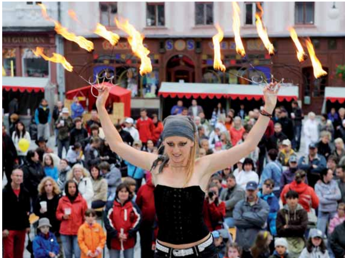
„Ohnivá“ dívka se svým fireshow při Krajských slavnostech na Mírovém náměstí v Jablonci nad Nisou.