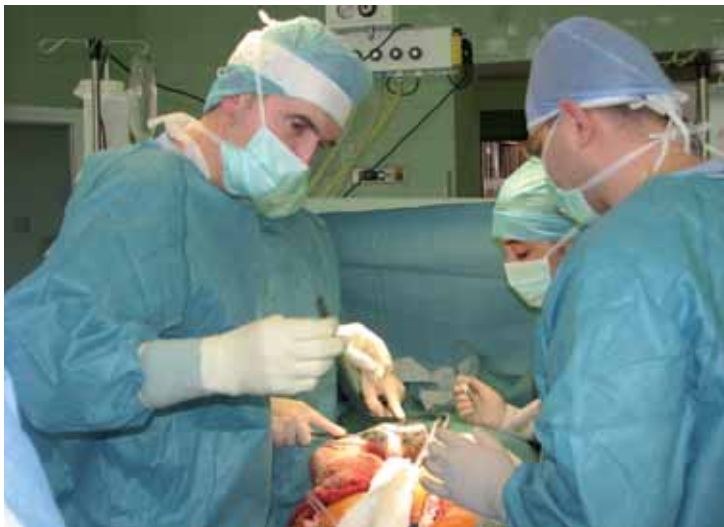
Oddělení cévní a rekonstrukční chirurgie ročně provede na operačních sálech chirurgického pavilonu 200 až 250 operací na velkých tepnách periferního cévního systému pacientů.

V roce 2009 pořádala Krajská nemocnice Liberec, a. s., ve spolupráci s odbornými lékařskými společnostmi několik celostátních a mezinárodních kongresů. Řada lékařů, působících v liberecké nemocnici, přednáší na zahraničních odborných akcích, zejména v oblasti neurochirurgie, traumatologie, hema-