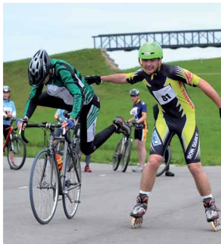
Na speciálním triatlonu ve Vesce se předávala štafeta z in line bruslí na kola.

Další akce programu vyCOOL se! se uskuteční 24. června na liberecké přehradě. Kompletní přehled akcí vyCOOL se! na www.vycoolse.cz . (rd)