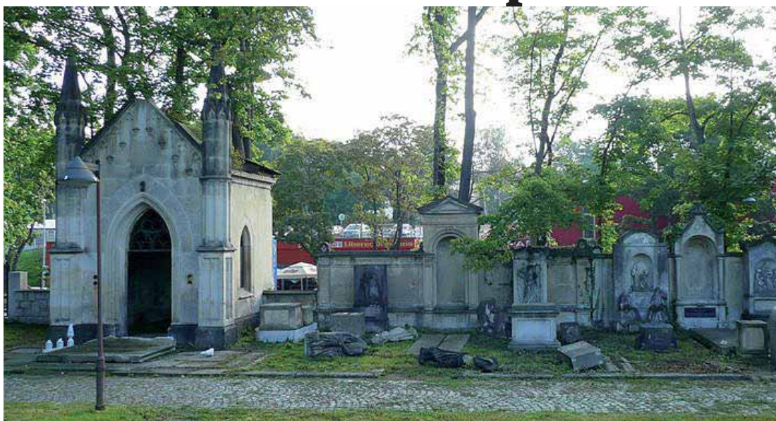
Liebiegova hrobka, jedna z významných památek v Liberci, která se dočká rekonstrukce.

Soutěž pro žáky základních škol nese podtitul „Kreslíme liberecké poklady“ a bude zahájena workshopem s povídáním o historii a místopisu Liberce. Děti na něm vytvoří jimi zvolenou výtvarnou technikou svůj pohled na liberecké poklady – vyberou si bu-