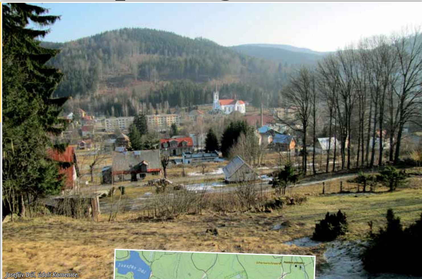
Josefův Důl, údolí Kamenice.

I dnes četné hotely a penziony nabízejí své služby k rekreaci a pro sport. Nesčetné turistické trasy se spoustou zajímavých přírodních míst stále lákají vstoupit právě z těchto míst do centra Jizerských hor. Příroda jakoby po staletí téměř netknutá dodávala člověku svou sílu a nabíjela duše optimismem. Je zážitkem vyhledat Kamennou komoru, alej deseti dubů, Peklo, Nebe, Ráj, nebo se vydat nejkrásnějším kaňonem Jedlové proti jejím toku za vodopády. Kousek za kostelem se zvedá turistická stezka od nádraží podél bystřiny