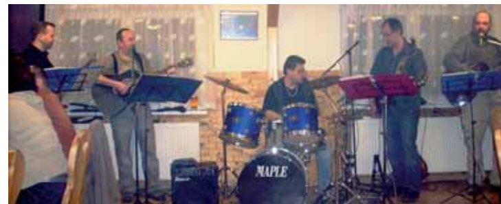
Kapela Odpadlíci hraje tradičně ve své hospůdce na Na hřišti v Mníšku.