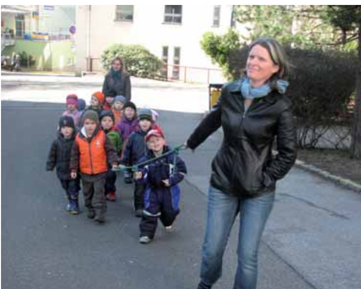
Děti z Mateřského centra Krteček na vycházce v areálu liberecké nemocnice.

Liberec | I když se Krajská nemocnice Liberec, a. s., nachází ve stísněných prostorách, dokáže nabídnout klientům a návštěvníkům všech věkových kategorií dost příležitosti k odpočinku a relaxaci. Chvilce čekání si tu mohou vyplnit děti, pro které bylo vyčleněno hned několik míst vybavených prostředky pro různé pohybové aktivity. Do klidného zázemí občas zavítají i skupinky dětí z okolních mateřských škol.