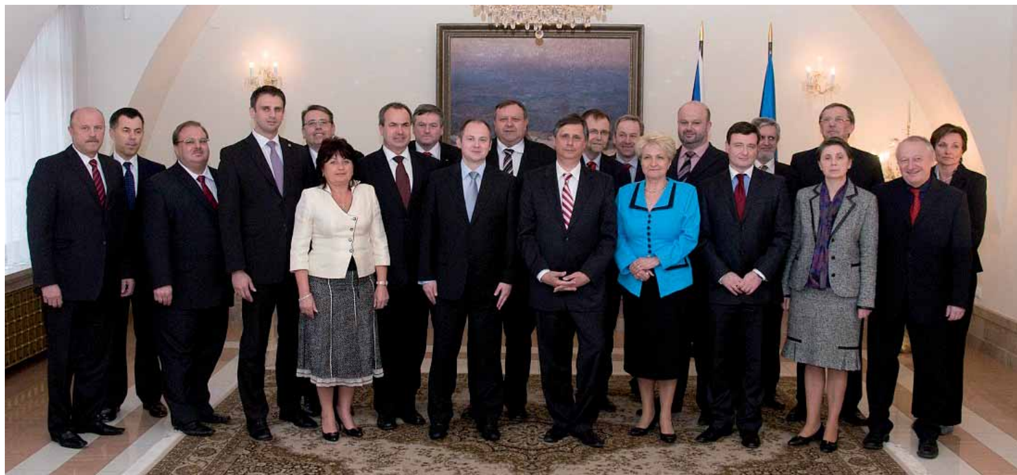
Hejtmani (liberecký na snímku sedmý zleva) se před květnovými volbami setkali s premiérem a členy vlády naposledy.