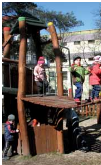
Pro děti je v areálu nemocnice vyčleněno hned několik míst vybavených prostředky pro různé pohybové aktivity.

Máte doma pěkné fotky, koláže, malby či případně výrobky z hlíny nebo jiných materiálů a nemáte je kde vystavit?