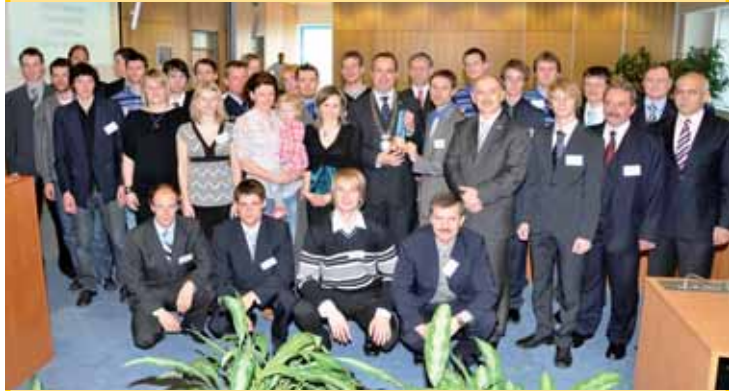
Olympijští reprezentanti ČR ve Vancouveru s vedením Libereckého kraje.

Podle něj Liberecký kraj připravil do české reprezentace z 93 účastníků letošních ZOH téměř 50 procent závodníků v 10 různých sportech. „A odečteme-li neúspěšné hokejisty, tak dokonce 65 procent olympioniků mělo klubovou příslušnost ve sportovních oddílech působících v našem kraji,“ doplnil s tím, že pokud jde o klasické lyžování, ve Vancouveru obsadili závodníci za Liberecký kraj dokonce 86,1 procenta míst v české reprezentaci. (lan)