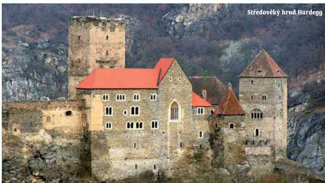
Středověký hrad Hardegg

ovšem mohou volně přecházet z jednoho parku do druhého. Přes Dyji je totiž zřízeno několik lávek pro pěší i cyklisty, které zaručují, že se turisté bez problému dostanou suchou nohou na druhý břeh. Lákadlem rakouské strany je i středověký hrad Hardegg Davy turistů míří do rakouského Thayatalu nejen za překrásnou a neporušenou přírodou. Jejich cílem je také návštěva