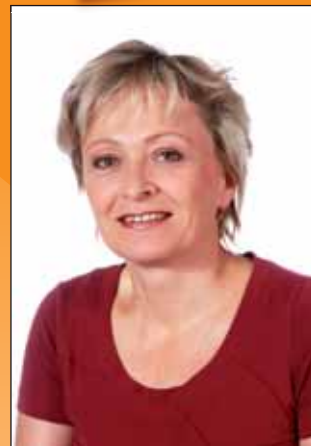
5. PharmDr. Jana Třešňáková radní Královéhradeckého kraje Hronov