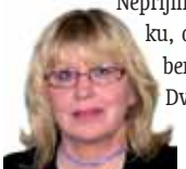
Připravila: Ludmila Petříková

Ryby 20. 2. - 20. 3. Než uděláte důležitá rozhodnutí, všechno si pečlivě promyslete a zvažte. Nepřijímejte žádnou nabídku, o které máte jen sebestmenší pochybnosti. Dvakrát měř, jednou řež je stále platná moudrost.