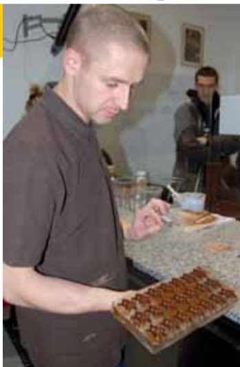
Ukázka výroby čokolády

osm metrů, dvakrát do roka se na nich objeví tisíce květů připomínající malé orchideje - takže čokoláda už je krásná vlastně od svého prvopočátku. První recept na výrobu čokolády pocházel od Aztéků a je starý více než dva a půl tisíce let. Jak ukazují jednotlivé vitríny muzea, dalo zřejmě péknu práci, než se z ručně rozdrcených kakaových bobů a dalších příměsí vytvořil lahodný nápoj, který se používal také jako lék. Nejen kvůli svým blahodárným účinkům byla čokoláda servírována v rozmanitých šálcích nebo konvičkách. Než si je prohlédnete, a to včetně už moderního stroje na výrobu tabulkové čokolády, čeká vás i náročná ukázka toho, jak dneska vznikají právě belgické čokoládové pra-