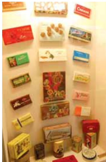
Obaly čokolád a kaka

linky. A všichni dostanou ochutnat! V další části muzea jsou pak vystaveny nádherné zdobené plechové nebo