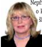
Připravila: Ludmila Petřiková

Ryby 20. 2. - 20. 3. Než uděláte důležitá rozhodnutí, všechno si pečlivě promyslete a zvažte. Nepřijímejte žádnou nabídku, o které máte jen sebestmenší pochybnosti. Dvakrát měř, jednou řež je stále platná moudrost.