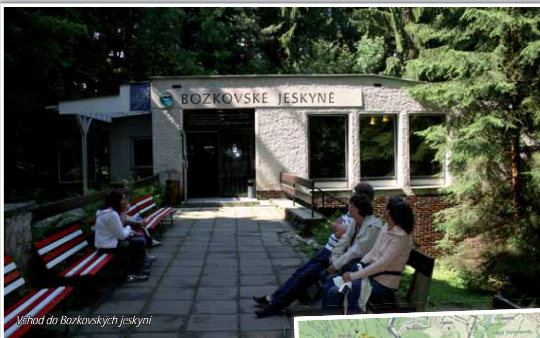
Věhod do Bozkovských jeskyní

letí a kamenná Madona z roku 1765. Kostel je významným poutním místem již po několik staletí. Novodobí poutníci však častěji navštěvují Bozkovské dolomitové jeskyně nedaleko podkrkonošské vesnice. Není tomu tak dávno, kdy podzemní katedrála přivítala první návštěvníky. První nálezy krás krápníkových komnat patří dělníkům, kteří odstřílili skálu v malém lomu na Vápenici v roce 1947. Dvacet let trvaly práce na odhalení celého systému podzemí a veřejnost má do jeskyní přístup od roku 1969. Již od rána sem každodenně přijíždí po celý rok návštěvníci a protože vstup je umožněn pouze skupinám o omezeném počtu osob, nikdy se nedá vyhnout frontám. Objevitelé nazvali jednotlivá místa