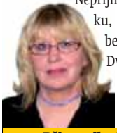
Připravila: Ludmila Petříková

Ryby 20. 2. - 20. 3. Než uděláte důležitá rozhodnutí, všechno si pečlivě promyslete a zvažte. Nepřijímejte žádnou nabídku, o které máte jen sebestyčnou pochybnost. Dvakrát měř, jednou řež je stále platná moudrost.