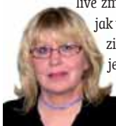
Připravila: Ludmila Petřiková

Ryby 20. 2. - 20. 3. Březen je váš měsíc, ale nebývá zpravidla obdobím klidu a pohody. Burylivé změny počasí ovlivňují jak vaši psychiku, tak fyzickou schránku, která je po zimě oslabená. Rovnováhu hledejte v literatuře.