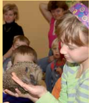
Školáci na Trutnovsku se přes zimu starají o ježky.

Děti z přihlášených škol dostaly příležitost starat se o ježka, který pro svoji nízkou váhu měl minimální šanci přežít zimu ve volné přírodě. Počátkem prosince dostaly od pracovníka Správy KRNP pokyny, jak se o ježka starat, čím ho krmit a vyslechny si přednášku o životě ježků v přírodě. Od té doby jsou ježci v jejich rukou. Musí jim čistit pelíšek, krmit je a vážit. Do „Deníku naší Bodlinky“ zapisují důležité údaje o péči, kterou mu