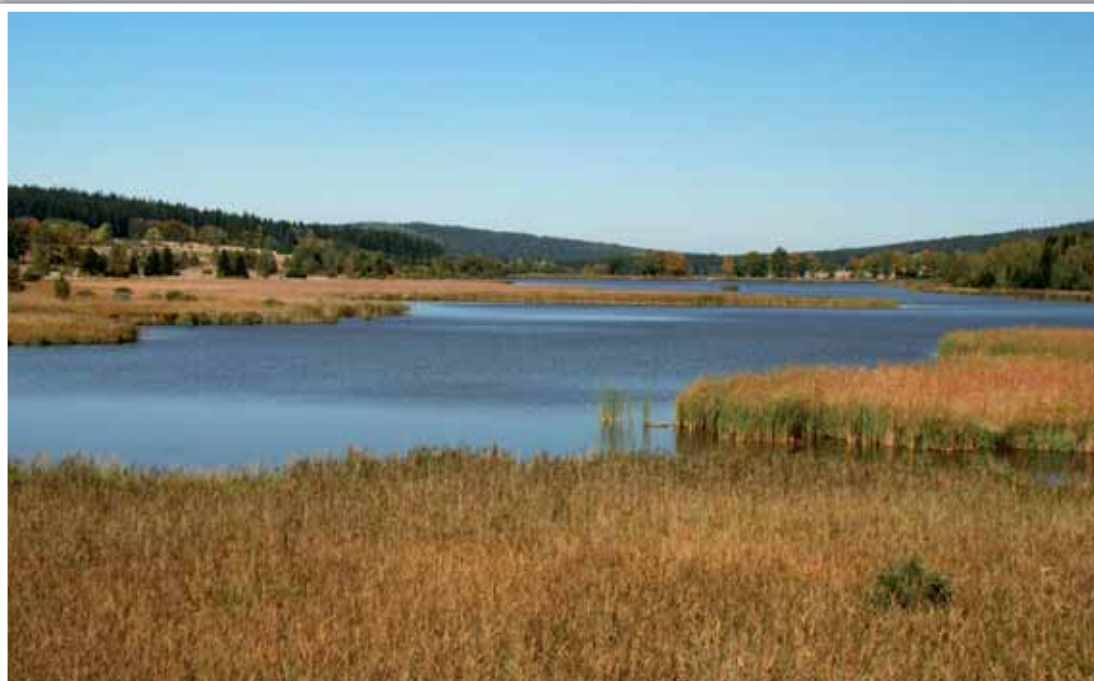
Text: Pavel MOULIS

deset kilometrů a vede převážně lesem po pevné cestě. Vycházka je připravena jako celodenní a s návratem je počítáno v odpoledních hodinách. Vzhledem k tomu, že se jedná o vojenský prostor je potřeba se předem na vycházku přihlásit na číslo 603239922, neboť kapacita je omezena. Vybrán bude poplatek na autobus 100 korun. Cílem vycházky je návštěva této lokality s výskytem mnoha vzácných druhů, nicméně pozornost bude upřena i k opeřencům, kteří se pozvolna vracejí z teplých krajín či zde hnízdícím orlům mořským. Doporučujeme se teple obléci, vzít si pohodlnou obuv, něco na opečení i drobný peníz, neboť je počítáno s návštěvou restaurace ve Skořicích. Výhodou bude pochopitelně i vlastní dalekohled.