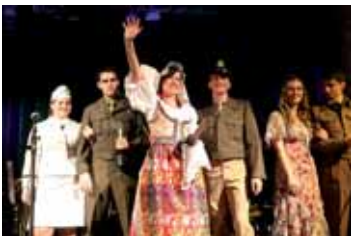
Na krajském plese, který se nesl v atmosféře osvobození Československa v roce 1945, byli oceněni účastníci v nejhezčím dobovém oblečení.

Ples byl prosycen dobovou náladou. Hlavní roli hrál swing, hudební směr, který sklízěl největší úspěchy ve 30.