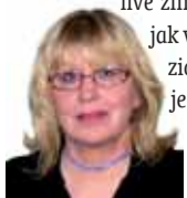
Připravila: Ludmila Petříková