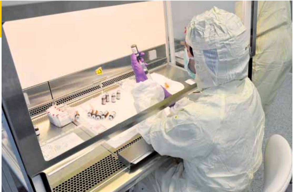
Lékárna Krajské nemocnice Liberec slouží pacientům a poskytuje služby jednotlivým oddělením nemocnic.

Ano, to náleží mezi několik málo odborných pracovišť v rámci celé ČR. Toto oddělení centrálního ředění cytostatik, tedy přípravků na léčbu nádorových onemocnění, zajišťuje přípravu pro oddělení KNL, a. s. Hlavními důvody centrální přípravy je zajistit jakost cytostatika pro pacienty, to znamená ochranu před mikroorganismy, ochránit zdravotnický personál před nebezpečnými účinky koncentrovaných cytostatik a snížit náklady. Velký důraz se klade už na příjem objednávky z oddělení, což se děje prostřednictvím počítačového systému, přičemž žádanka obsahu-