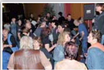
Parquet byl stále plný tanečníků.