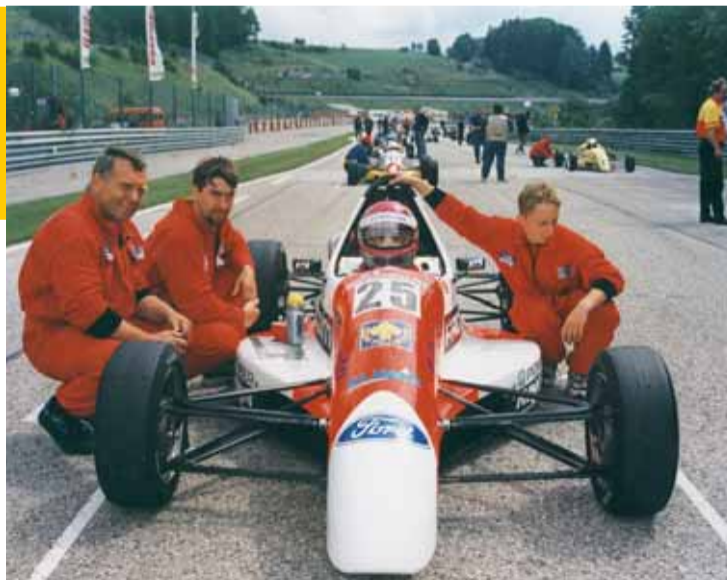
Závodní tým na startu pohárového závodu formule na okruhu na Slazburgringu.

To nebyla konečná, podnikatelské aktivity rodiny Dordových pokračo-