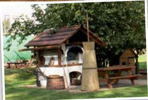
Největší tlučka na světě.

Kontakty: Bílý Kostel nad Nisou 49, 463 31, Telefon: +420 485 143 440,