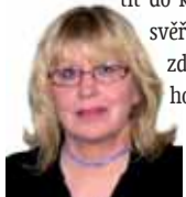
Připravila: Ludmila Petřiková

Ryby 20. 2. - 20. 3. Nezapomínejte se problémy jiných více než svými vlastními. Nesnažte se vcítit do každého, kdo se vám svěří. Starajte se o své zdraví, místo dlouhých hovorů v kavárnách se věnujte procházkám v přírodě.