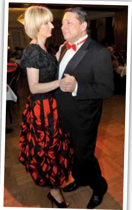
VII. reprezenční plesu statutárního města Teplice se zúčastnili také manželé Paroubkovi. Předseda ČSSD je totiž lídrem kandidátky sociální demokracie za Ústecký kraj pro květnové volby do Poslanecké sněmovny PČR.