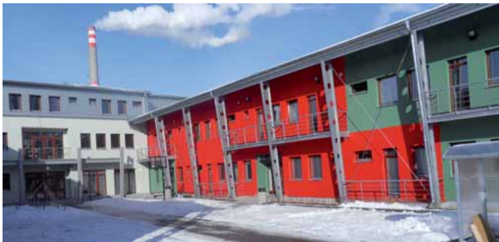
Nový Domov mládeže Vyšší odborné školy obalové techniky ve Štětí.

tisíciletí. Nové ubytovací buňky slouží vždy čtyřem studentům ve dvou ložnicích. Mají samostatné kuchyňky i sociální zařízení. V areálu domova mládeže jsou i studovny, počítačová pracoviště, prostory pro sport, posilovna i místnosti pro návštěvy a také další zázemí domova i samotné školy.