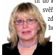
Připravila: Ludmila Petříková

Ryby 20. 2. - 20. 3. Nezabývejte se problémy jiných více než svými vlastními. Nesnažte se vcítit do každého, kdo se vám svěří. Starajte se o své zdraví, místo dlouhých hovorů v kavárnách se věnujte procházkám v přírodě.