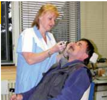
Centrum péče o zrak ve Strakonici