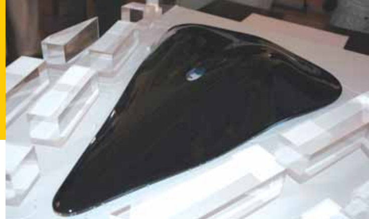
Takto má nové koncertní a kongresové centrum vypadat.

Č. Budějovice | Takzvaného Rejnoka, koncertní a kongresové centrum navržené architektem Janem Kaplickým, maximální možnou měrou podporují představitelé krajského města. Když se velký architekt nedočká Národní knihovny v Praze, bude mít alespoň jedinečnou stavbu na jihu Čech.