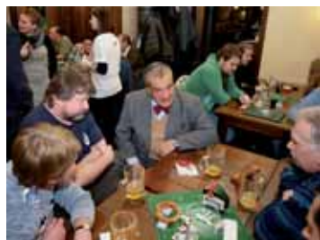
Karel Schwarzenberg diskutoval s občany i nad sklenicí plzeňského piva.