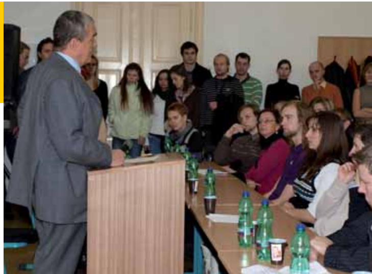
Karel Schwarzenberg při besedě se studenty Západočeské univerzity v Plzni.

ústřední téma volební kampaně své strany TOP 09 – a to boj proti bobtnajícímu korupčnímu prostředí v ČR. „Počátkem 90. let čeští politici a intelektuálové uvažovali o modelech, které bude naše ekonomika kopírovat. Jedni se přiklání k modelu německému, jiní zase k modelu anglosaskému či skandinávskému. Téměř po dvaceti letech je však z mnoha indicií zřejmé, že se vítězně prosadil model sicilský,“ řekl Schwarzenberg.