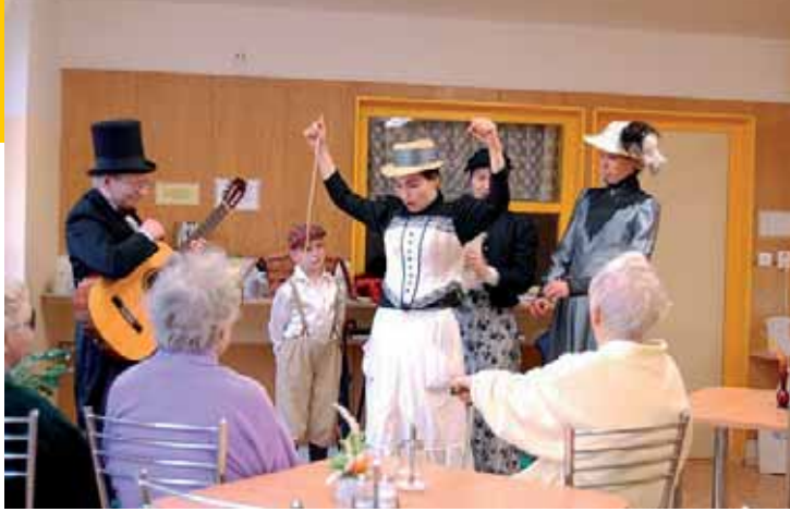
Nevšedním zážitkem pro klienty Krajské nemocnice Liberec, a. s., byly jarmareční zpěvy v jídelně ORL v podání souboru Katastrofální předpověď počasí.

Do LDN docházejí dobrovolníci za pacienty potěšit je laskavým slovem a strávit s nimi alespoň trochu času. Hlavní činností dobrovolníků na oddělení on-