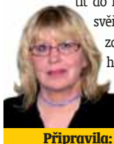
Připravila: Ludmila Petřiková

Ryby 20. 2. - 20. 3. Nezabývejte se problémy jiných více než svými vlastními. Nesnažte se vcítit do každého, kdo se vám svěří. Starejte se o své zdraví, místo dlouhých hovorů v kavárnách se věnujte procházkám v přírodě.