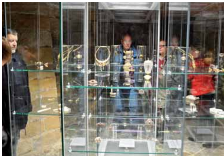
Šperky v nově otevřené stálé expozici Klenotnice turnovského Muzea Českého ráje pocházejí ze školní sbírky od roku 1891 do roku 1954.

historismu, secese a art-deco. Cenné práce ležely ukryté ve školním trezoru, protože nebyly podmínky k jejich bezpečnému vystavení. Loni se část kolekce vystavovala ve Vídni a sklídila obrovský úspěch.