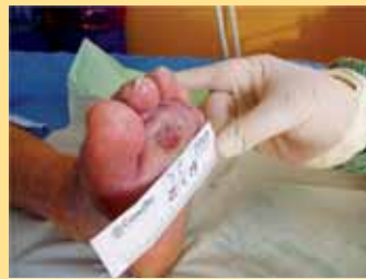
Defekty na noze byly při přijetí na diabetologické oddělení velmi hluboké a citlivý čtenář by je nemusel snést, proto představujeme alespoň zcela zahojenou ránu po úspěšné aplikaci larvami.

Podle rozsahu postižené plochy se do rány aplikuje 150 až 600 larev. Od 1. listopadu 2008 hraří aplikaci larev VZP pod kódem 13071, podmínkou je aspoň jednodenní hospitalizace. Léčba musí být schválena revizním lékařem. Pojišťovna hraří maximálně tři aplikace do roka. (pa)