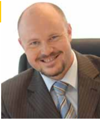
Vicehejtman Radek Vonka.

„ Děčín je tradiční vstupní branou do pískovcové krajiny Česko-saského Švýcarska. Tuto oblast všichni považujeme za jednu z nejatraktivnějších přírodních turistických lokalit nejen Ústeckého kraje či České republiky, ale skutečně v celosvětovém měřítku. Dnes diskutujeme o výjimečnosti tohoto příhraničního území a chceme se pokusit nastoupit na cestu, jež tuto výjimečnost potvrdí exkluzivní