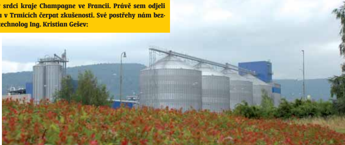
Pohled na Průmyslový lihovar v Trmicích, jehož představitelé byli na zkušené v Provins ve Francii.

První a také nemalé překvapení jsme zažili, když jsme do cíle cesty dojeli. Provins je krásné a malebné městečko asi s 30 000 obyvateli, se starobylým hradem na návrší uprostřed města. Neuvěřitelně množství zeleně, trochu jako městečko v parku nebo v zahradě. A uprostřed něj stojí již 80 let zemědělský lihovar. Původně to byl melasový lihovar, ale před 20 lety byl rekonstruovaný na obilní. Ostatně Provins leží uvnitř velké „obilnice“ Francie. Zdejší výroba se orientuje na dodávky pro nejvýznamnější francouzskou rafinérskou