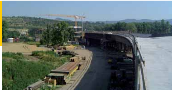
Za odbočkou na Mlékojedy už vyrůstá nájezd na nový litoměřický most přes Labe.

V první části budování díla, investorsky zajišťovaného Ústeckým krajem, byla předloni otevřena okružní křižovatka mezi Tereziínem a Lovosicemi, vloni v srpnu úsek se sjezdem k Prosmykům a 3. července byla slavnostně ukončena třetí etapa stavby. Řidiči mohou uživat komunikaci mezi kilometry 1,6 až 2,85 se sjezdem do obce Mlékojedy. Symbolickým přestřižením pásy bylo dílo za 280 milionů korun od Státního fondu dopravní infrastruktury dokončeno a začne sloužit motoristické veřejnosti.