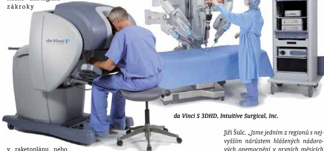
da Vinci S 3DHD, Intuitive Surgical, Inc.

Vinci představuje v moderním pojetí chirurgie skutečný pokrok. Jeho vývoj zahájili v zámoří, když lékaři na druhé straně Atlantického oceánu přemýšleli, jak provést ze země řízené chirurgické zákroky