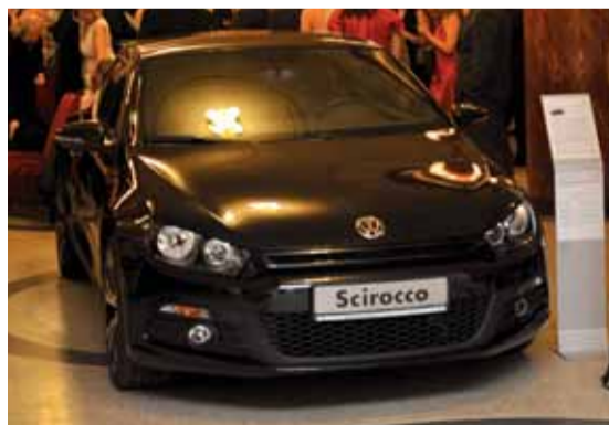
Sportovní kupé VW Scirocco – auto roku 2009.

A protože šlo o ples Autocentra Elán – prodejce vozů značek Audi, VW a Škoda v Ústeckém kraji – nechyběla ani ukázka jednoho z modelů v předsáli. Letos jim byla opravdová lahůdka - sportovní kupé VW Scirocco – auto roku 2009. I pro pořadající společnost byl loňský rok úspěšný. Do tří autosalonů zmíněných značek si pro osobní a užit-