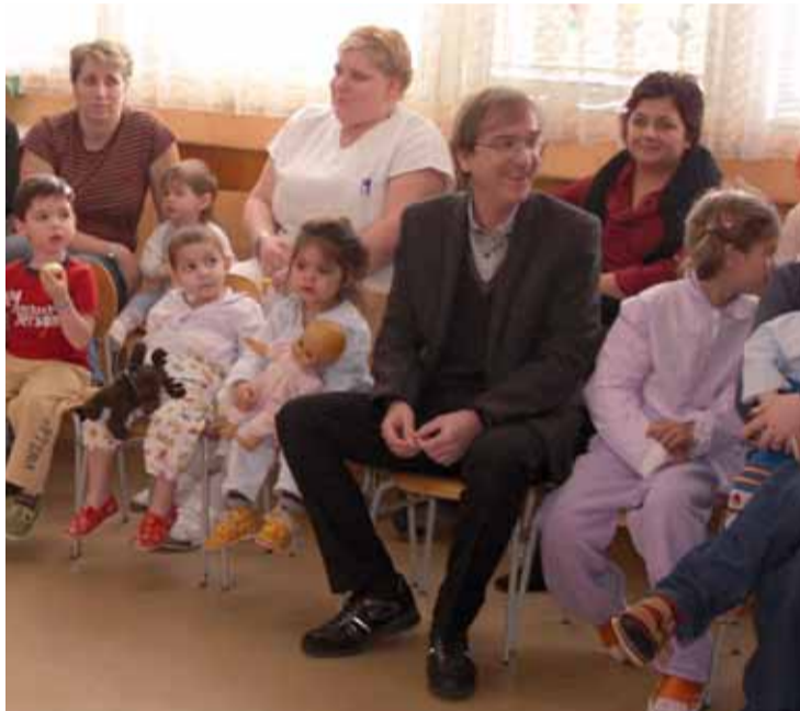
Zpěvák Miro Žbirka navštívil pacienty na dětské klinice Masarykovy nemocnice.

tivní akci, během jejíhož vysílání budou moct diváci posílat tzv. dárcovské, DMS zprávy. (von)