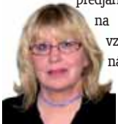
Připravila: Ludmila Petřiková

Ryby 20. 2. - 20. 3. Ačkoliv se to zdá nepravděpodobné, ve vzduchu už brzy začne vonět předjaří. Ledy roztají nejen na rybnících, ale i ve vztazích. Projevte svoji náklonnost všem, koho máte rádi. Navštivte třeba příbuzné.