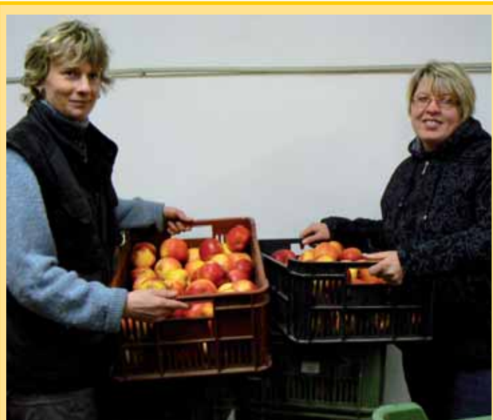
Taková krásná jablka vysrostla v sadech v Nebílově na Plzeňsku. Nyní jsou v prodeji také v Přesticích na náměstí, kde kromě několika druhů jablek nakoupíte i čerstvý mošt či mošt pasterizovaný v pětilitrovém balení, který si sad nově vyrábí z vlastní sklizně. (vz)

Vstupenky je možno zakoupit v Informačním centru města Plzně na náměstí Republiky 41.