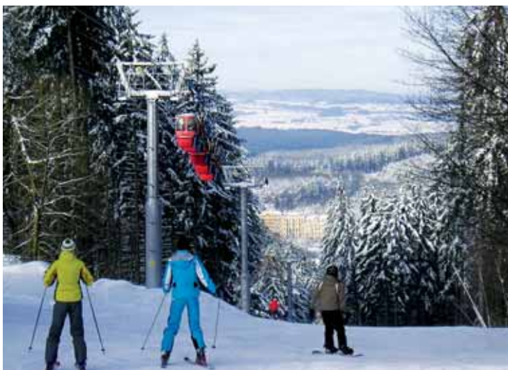
Začátek sjezdovky Krakonoška.

vštěvníky je oblíbená sjezdová trať Krakonoška. Pestřejší je výběr časových jízdů od půldenních, denních po vícedenní včetně výrazných slev pro skupiny a lyžařské výcviky. K dispozici je skibar, skipůjčovna, skiservis, sociální zázemí a parkovací plochy. V rámci areálu funguje lyžařská a snowboardová škola.