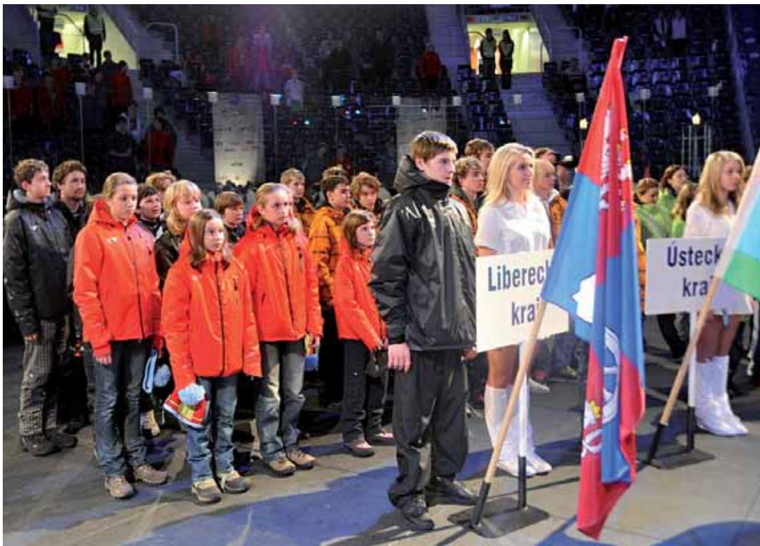
Vítězný tým Libereckého kraje vybojoval celkem padesát tři medailí.

Na skokanském můstku se prosadily reprezentantky LK, které v kategorii nejmladších žaček obsadily stupeň