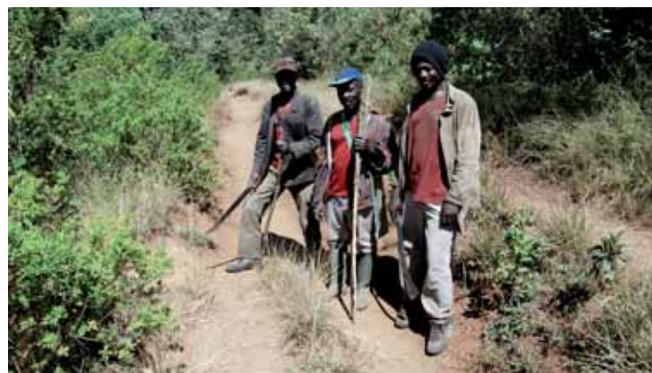
Lovci a zemědělci se chystají vypálit další kus pralesa, chybí jim vzdělání, jak pěstovat zemědělské plodiny bez vypalování lesů.

„Ake by zároveň měla poskytnout prostor začínajícím libereckým umělcům a řemeslníkům. Proto mimo jiné plánujeme vystoupení liberecké ska kapely Doo-WhenBlade, pražské skupiny Tiditade, Female Afrobeat a další. Zapojí se také studenti SPŠ textilní Liberec, kteří budou