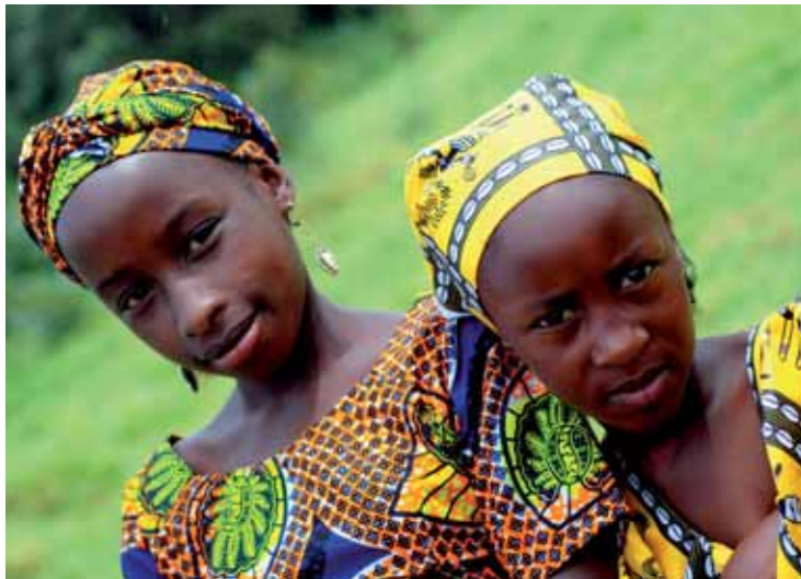
Z těchto pestrých kamerunských látek se budou šít šaty na benefiční prodej.

navyklo na horské podmínky,“ uvedl čtyřicetiletý vědec.