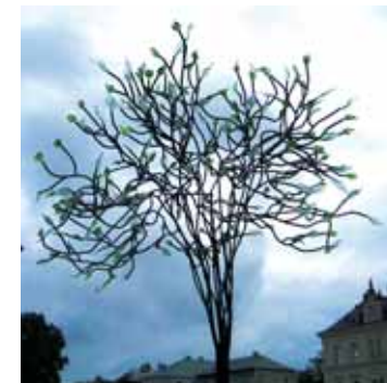
Hra světla a kumštu lidských rukou

herných hor a pracovití lidé vybudovali sklářskou velmoc, stejně významnou po celé zeměkouli jako Jablonec nad Nisou se svou bižuterií. Obě sídla proslavila Rakousko-Uhersko a později Československo jako obchodní velmoc v oblasti skleněné produkce. Nový Bor je také místem historické Rumburské vzpoury z roku 1918, její aktéři mají na hřbitově pomník. Sklářská škola, poutě, symposia. Jsou zde i velké továrny na výrobu užitkového skla a další dílny na zpracování produktů sklářských výro-