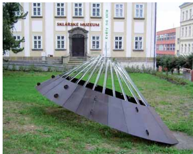
Socha zpodobňující loď - cestu skla do zámoří