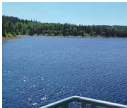
Vodní dílo Fláje.