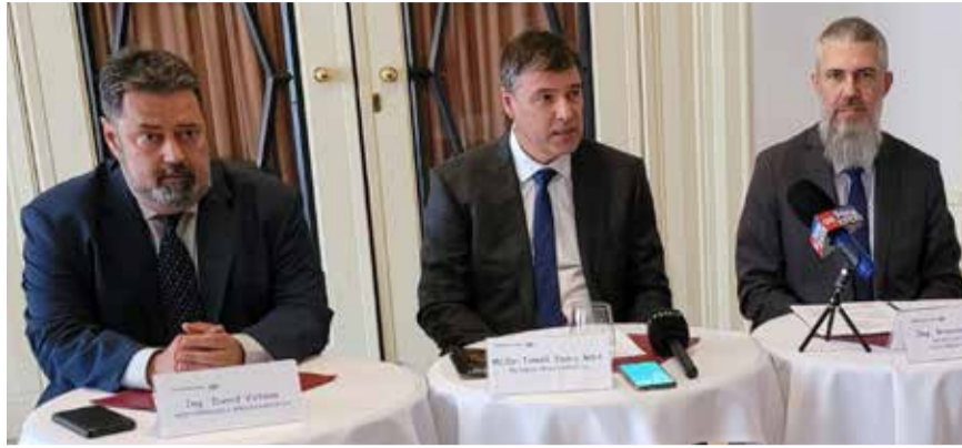
Vedení Severočeské vodárenské společnosti.

Teplice | Ve čtvrtek 11. června se v Teplicích konala valná hromada Severočeské vodárenské společnosti (SVS). Zúčastnilo se jí 134 akcionářů - zástupců měst a obcí z Ústeckého a Libereckého kraje - kteří představují 78 procent základního kapitálu této společnosti.