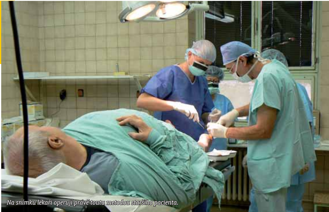
Na snímku lékaři operují právě touto metodou staršího pacienta.

Podle něho má léčba velmi dobrý efekt. „Přináší zlepšení u artrózy, úlevu od bolesti a hlavně oddaluje okamžik, kdy je nutná náhrada kloubu endoprotézou,“ upřesnil primář chirurgie Václav Karnos.