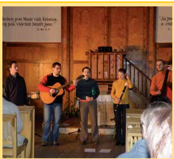
Několik desítek lidí navštívilo koncert skupiny Zebedeus, který se v rámci akce „Noc otevřených kostelů“ uskutečnil ve večerních hodinách v pondělí 18. ledna v Husově kapli v Merklíně. Vybrané dobrovolné vstupné bylo odesláno jako dar pro pomoc postiženým zemětřesením na Haiti.