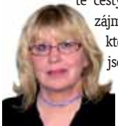
Připravila: Ludmila Petříková

Ryby 20. 2. - 20. 3. Smířte se s tím, že nikdy nebude- te umět použít sílu loktů. Proto si hledej- te cesty k prosazení svých zájmů podle možností, které máte. Zbraněmi jsou taktika, trpělivost, ale i sexuální přitaž- livost.