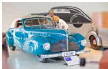
Technické muzeum Pardubického kraje Vysoké Mýto.