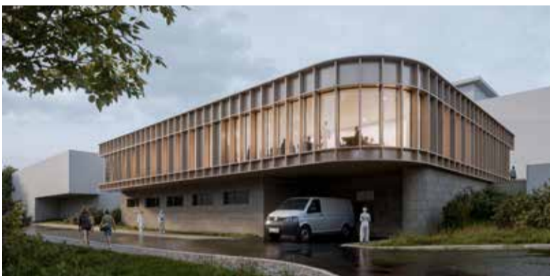
Studie - Stravovací provoz Orlickoústecké nemocnice.