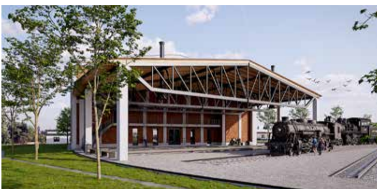
Vizualizace - Muzeum Dolní Lipka.