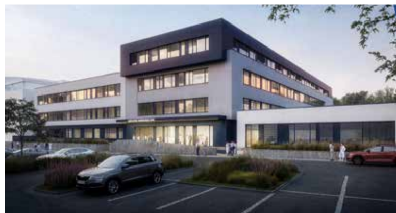
Svitavská nemocnice - vizualizace.